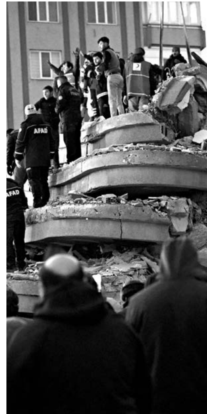
A Dilok centenars d'edificis van col·lapsar després del terratrèmol LISA HASTERT | PROTECCIÓ CIVIL UE

L'autoorganització ha estat la principal via de fer front a les necessitats que han sorgit. A les zones de Bakur (Kurdistan del nord) i Turquia afectades, di-