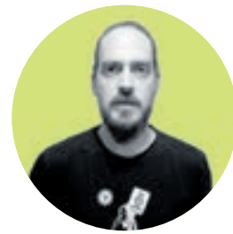
Agustín Yañez Luco Secció Sindical Joan XXIII

Podríem parlar del sector social a Catalunya des d'un anàlisi típicament sindical: una realitat laboral molt dura; unes condicions particulars d'explotació; el desenvolupament d'una petita oligarquia empresarial hormonada a base de subvencions públiques; la típica màfia sindical de CCOO i UGT falsejant negociacions en foscos despatxos per perpetuar la precarietat de les treballadores allunyant-nos d'experiències sindicals combatives i d'autoorganització. Però, ¿quantes de les persones que llegim aquesta publicació no podríem dir el mateix de qualsevol dels nostres sectors?: patronal guanyant convenis, els sindicats de les gables en cerca i captura, les treballadores segregades i explotades somiant en clau de consum i així, l'espiral de la derrota, mirant-se en un mirall infinit.