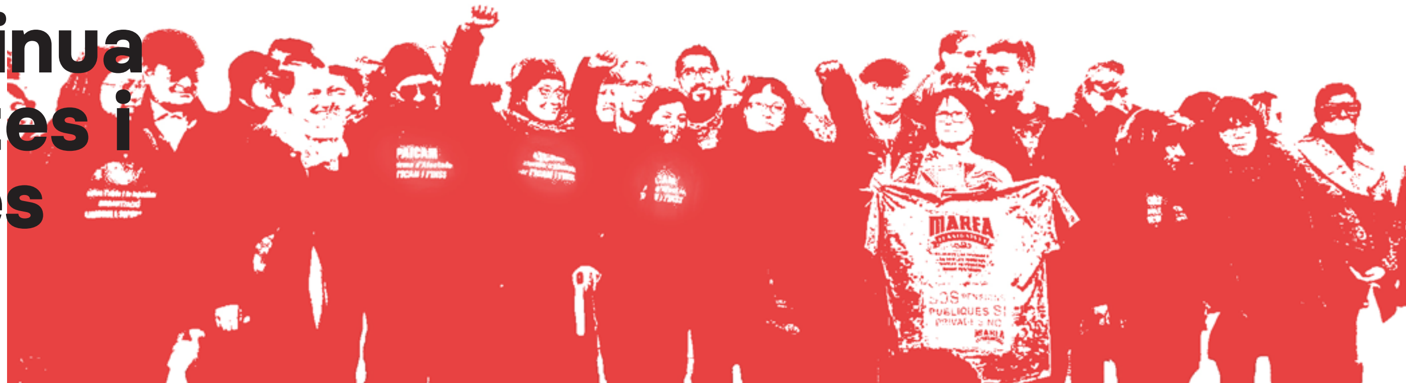
PAICAM - PLATAFORMA D'AFECTADES PER L'ICAM I L'INSS

Per resolució del passat 30 de desembre de 2022 es va aprovar la «prórroga y modificación al Convenio entre el Instituto Nacional de la Seguridad Social y la Generalitat de Catalunya, para el control de la incapacidad temporal», on es determinen les condicions a través de les quals l'INSS (administració estatal) transmet fons econòmics per a l'ICS (administració autonòmica) per fer el control de les baixes i avaluar les possibles invalideses. Un cop més es reiteren, com en els anteriors convenis, els criteris «economicistes» que regulen unes quanties econòmiques més altes si les Incapacitats Temporals són més curtes i els dictàmens d'invalidesa més restrictius.