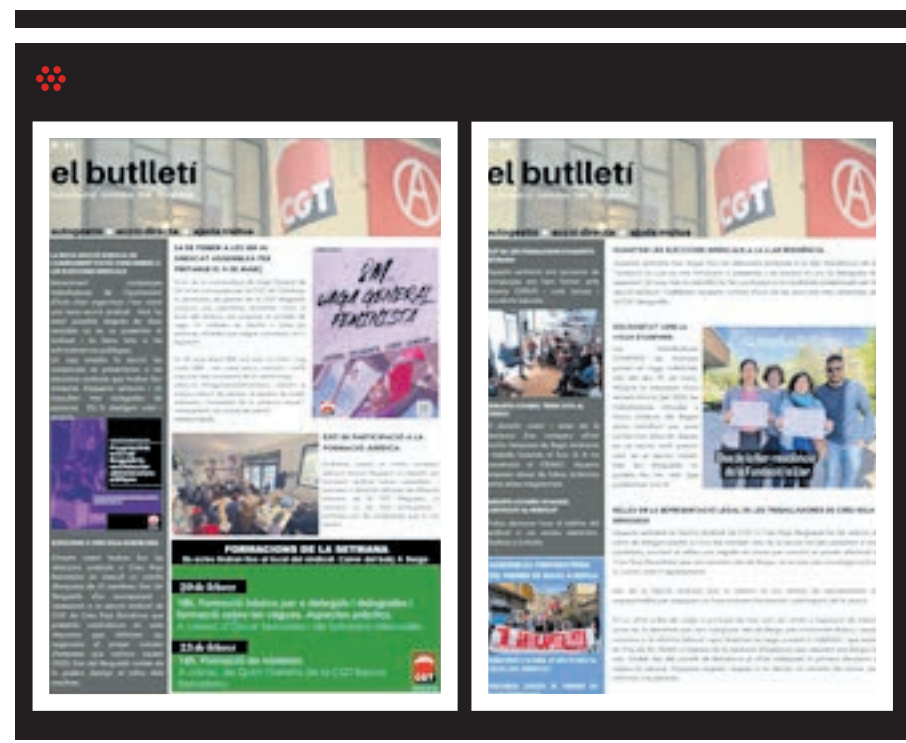
El butlletí, serveix com una eina per a la difusió interna i que totes les persones afiliades al sindicat estiguen al dia de les diferents lluites i activitats