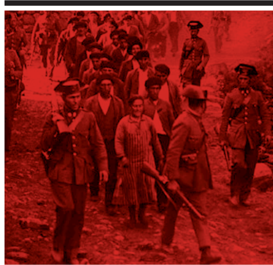
Recordem encara com les vagues del tèxtil a la comarca, amb la complicitat dels miners, desembarcarien en la revolució de l'Alt Llobregat (1932) i a la proclamació del comunisme llibertari en diversos municipis.

E l Berguedà, a l'Alt Llobregat (Barcelona), ha estat una comarca amb un marcat caràcter industrial en el passat. Al llarg del riu es trobaven nombroses colònies tèxtils; al nord de la comarca hi havia mines, una cimentera, Carbuross Metàlics... Hi havia un proletariat important des del segle XIX i les idees llibertàries arrelarien en totes aquestes colònies on els extrems eren tan marcats, de les fàbriques i les mines i els pisos dels obrers a les torres de l'amo .