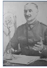
Queipo de Llanos en la radio

El pasado lleva consigo un índice temporal mediante el cual queda remitido a la redención. Existe una cita secreta entre las generaciones que fueron y la nuestra. Y como a cada generación que vivió antes que nosotros, nos ha sido dada una flaca fuerza mesiánica sobre la que el pasado exige derechos. No se debe despachar esta exigencia a la ligera.