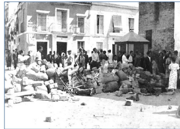
Barricadas en la plaza de san Marcos