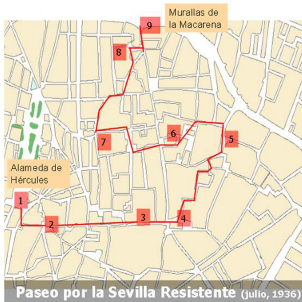
Paseo por la Sevilla Resistente (julio, 1936)

1º mayo | Ayer, hoy y siempre, la lucha está en la calle | 01052023