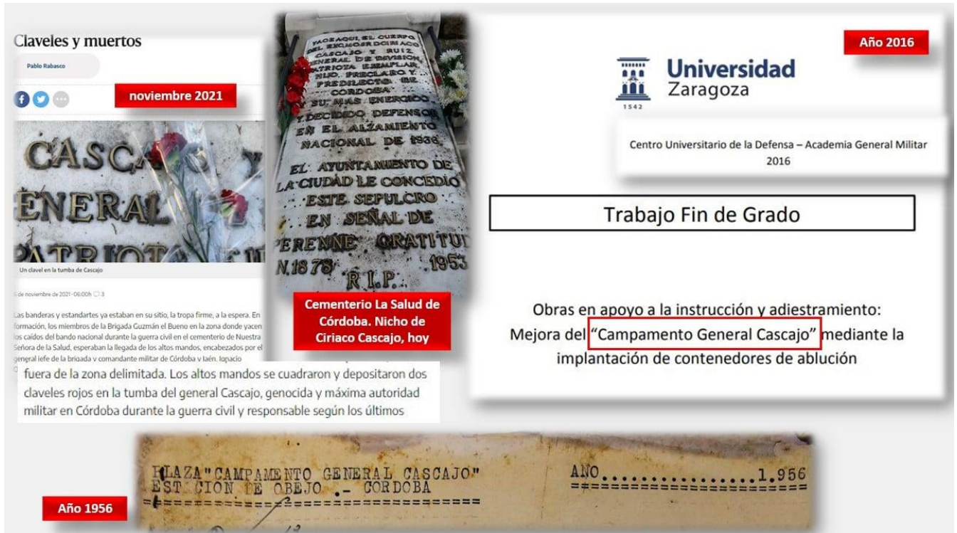
Imagen 5. Detalle de la noticia aparecida en prensa, dando cuenta del homenaje realizado por militares el pasado 1 de noviembre en el cementerio de La Salud, denunciando que durante el acto se depositaron flores en la tumba del golpista Ciriaco Cascajo. Detalle de sumario abierto en 1956 en el campamento Ciriaco Cascajo de Cerro Muriano (Obejo, Córdoba). Trabajo de Fin de Grado redactado en 2016 en la Academia General Militar de Zaragoza, donde se aprecia que el campamento mantiene todavía esa denominación.

CONFEDERACIÓN GENERAL DEL TRABAJO (CGT) Secretariado Permanente del Comité Confederal Sagunto, 15 - 1º, 28010-Madrid Telef.: (91) 447 57 69 - Fax: (91) 445 31 32 sp-general@cgt.org.es - cgt.org.es