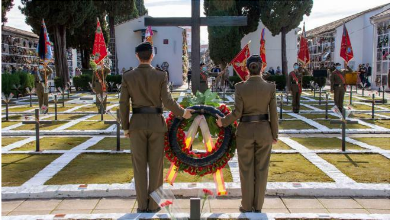
Imagen 1. Militares de la Brigada Guzmán el Bueno de Cerro Muriano durante el homenaje ante fosas de militares franquistas el pasado 1 de noviembre de 2021 en el cementerio de San Rafael de Córdoba.