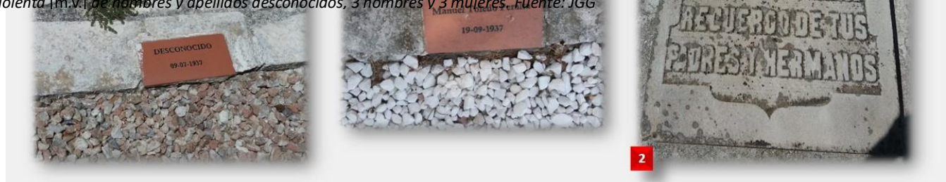
Imagen 2. Cementerio de La Salud de Córdoba, cuadros militares de Santa Bárbara y San Sancho, donde se realizan homenajes por las Fuerzas Armadas españolas: [1] Placas de militares franquistas muertos en frente de guerra en 1937 y enterrados en esos cuadros. [2] Lápida de jefe de Falange de bandera de Tenerife muerto "por dios y por la patria" en julio de 1937 en el frente de guerra.