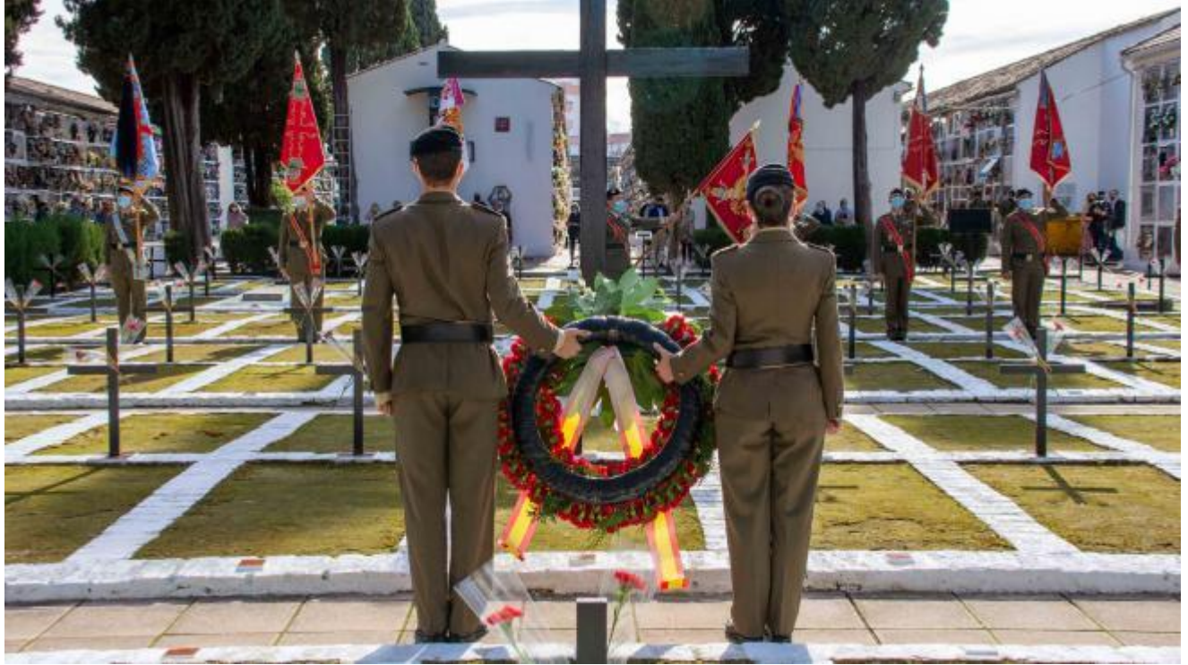
Imagen 1. Militares de la Brigada Guzmán el Bueno de Cerro Muriano durante el homenaje ante fosas de militares franquistas el pasado 1 de noviembre de 2021 en el cementerio de San Rafael de Córdoba.