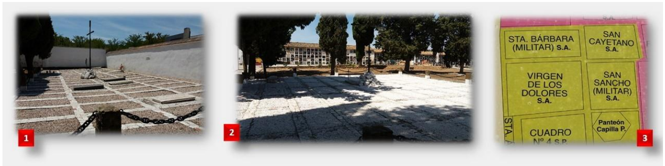
Imagen 3. Cementerio de La Salud de Córdoba: [1] Cuadro militar de Santa Bárbara y [2] Cuadro militar de San Sancho, donde se encuentran enterrados militares golpistas y se realizan homenajes por las Fuerzas Armadas. [3] Plano de situación de ambos cuadros junto a los de San Cayetano y Virgen de los Dolores, donde se han localizado varias fosas comunes del franquismo.