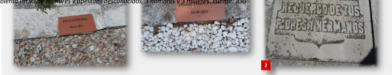
Imagen 2. Cementerio de La Salud de Córdoba, cuadros militares de Santa Bárbara y San Sancho, donde se realizan homenajes por las Fuerzas Armadas españolas: [1] Placas de militares franquistas muertos en frente de guerra en 1937 y enterrados en esos cuadros. [2] Lápida de jefe de Falange de bandera de Tenerife muerto "por dios y por la patria" en julio de 1937 en el frente de guerra.