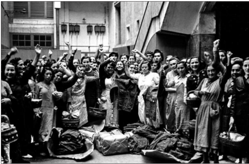
Donativo de ropa en fábrica textil colectivizada, 1936

La tasa de actividad femenina en 2020 cayó 10,7 puntos, y la brecha salarial entre hombres y mujeres aumentó por encima del 40% mientras que el 74,03% del empleo a tiempo parcial fue femenino, con lo que eso supone a la hora de la cuantificación del importe de las pensiones. La pobreza femenina es un hecho incuestionable. Durante ese año, las mu-