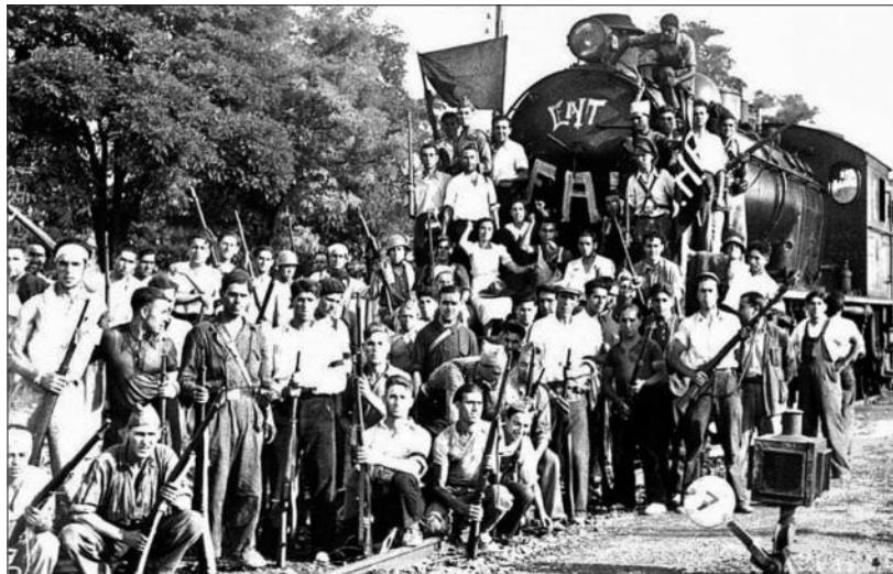
▲ La Columna de Hierro a su llegada en tren a Barracas (la vía estaba sabotada más allá), agosto de 1936.

Afortunadamente, hay mucho material digitalizado de fácil acceso, principalmente prensa y “causa general”, que posibilitan búsquedas