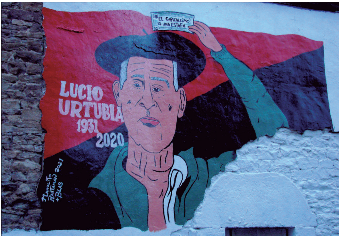
MURAL DE MANOLITO RASTAMÁN EN RUESTA