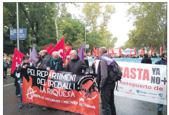
Madrid, 27 de octubre