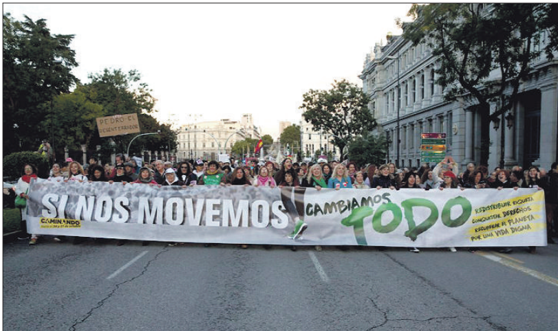
Madrid, 27 de octubre