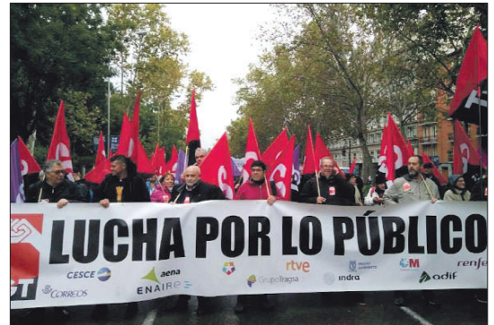
Madrid, 27 de octubre