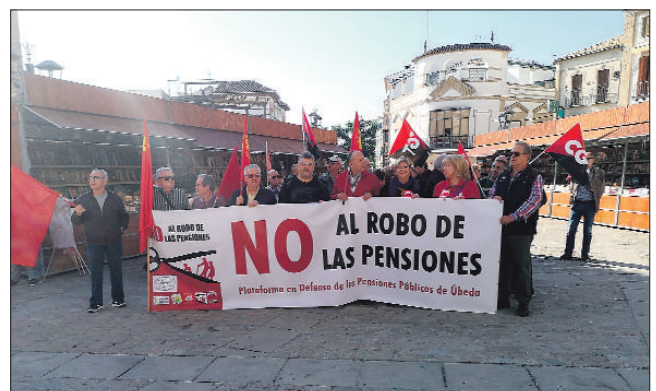
Úbeda, 24 de octubre