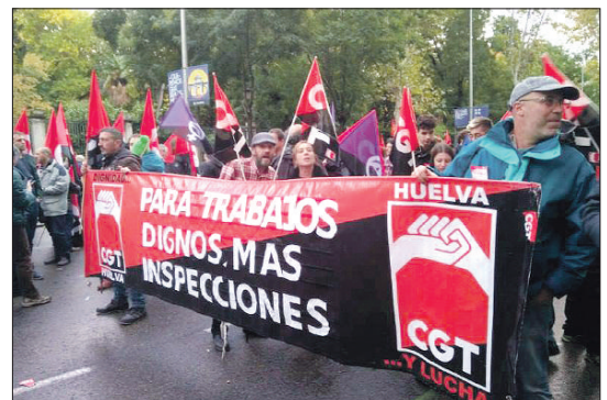
Madrid, 27 de octubre