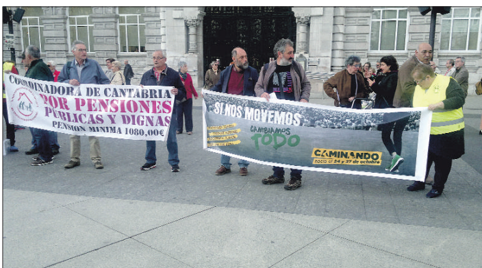
Cantabria, 24 de octubre