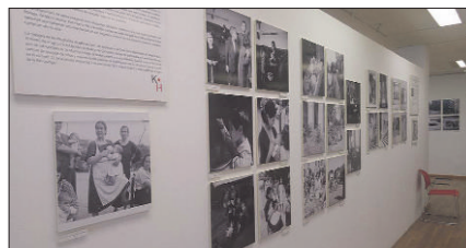
Exposición: "La mirada de Kati Horna".