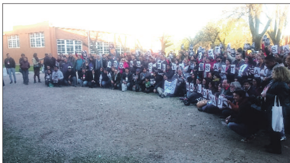
Foto final del Encuentro en solidaridad con Santiago Maldonado.