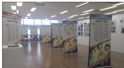
Exposición: "La mujer en el anarquismo español".