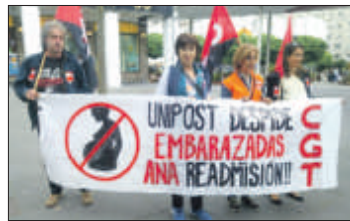
Sección Sindical Unipost Santiago-CGT