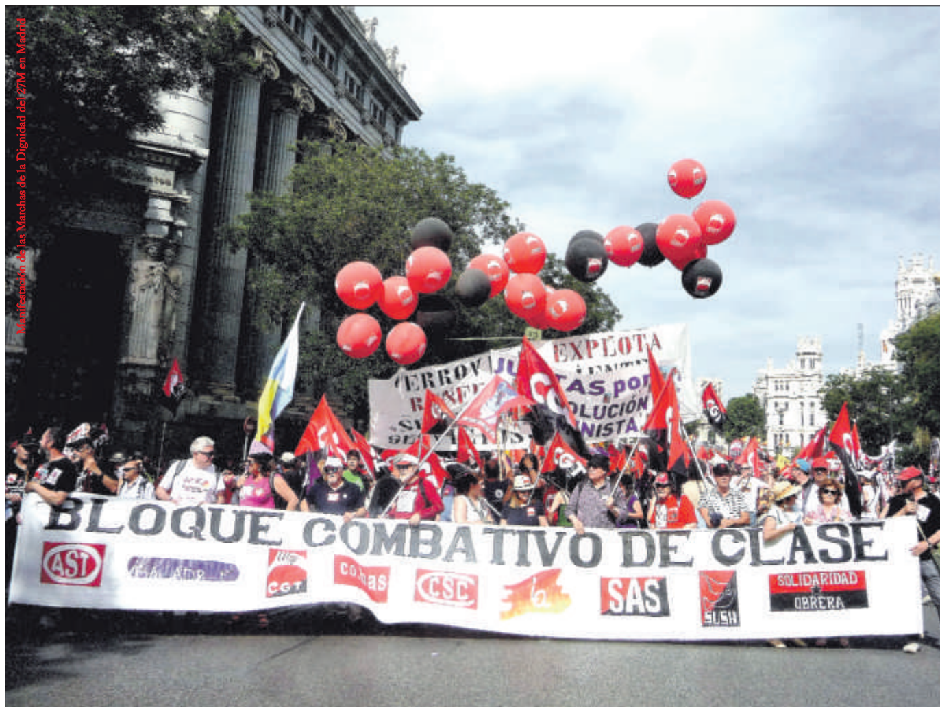
Manifestación de las Marchas de la Dignidad del 27M en Madrid