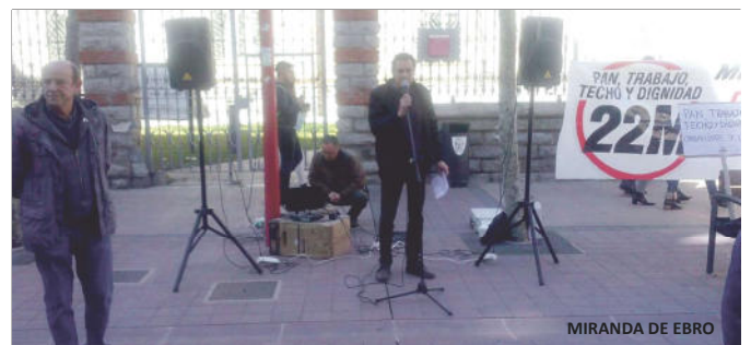
MIRANDA DE EBRO