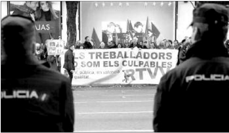
Concentració davant l'Audiència Nacional a Madrid l'11 de gener de 2017, dia del judici. Delegació de Govern va multar al sindicat adduint excés de temps de reunió. La CGT ha interposat recurs.