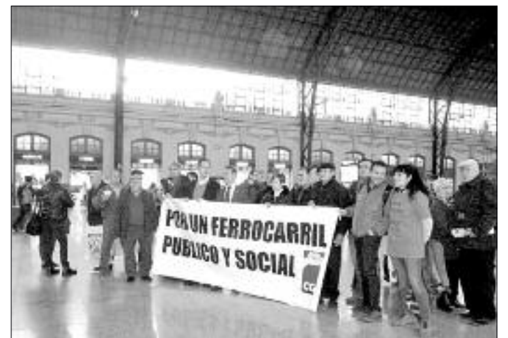
Acte en defensa de la línia València-Conca-Madrid.

Així mateix, aquestes noves regles, permeten la potenciació de determinats corredors ferroviaris, en perjudici, evidentment, de les línies convencionals, i que, de ben segur, seran les que ja estan