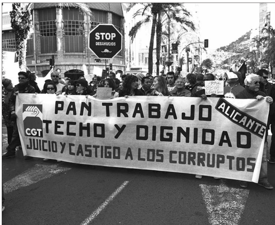
Manifestació celebrada el 24 de gener a Alacant contra els desnonaments / CGT ALACANT