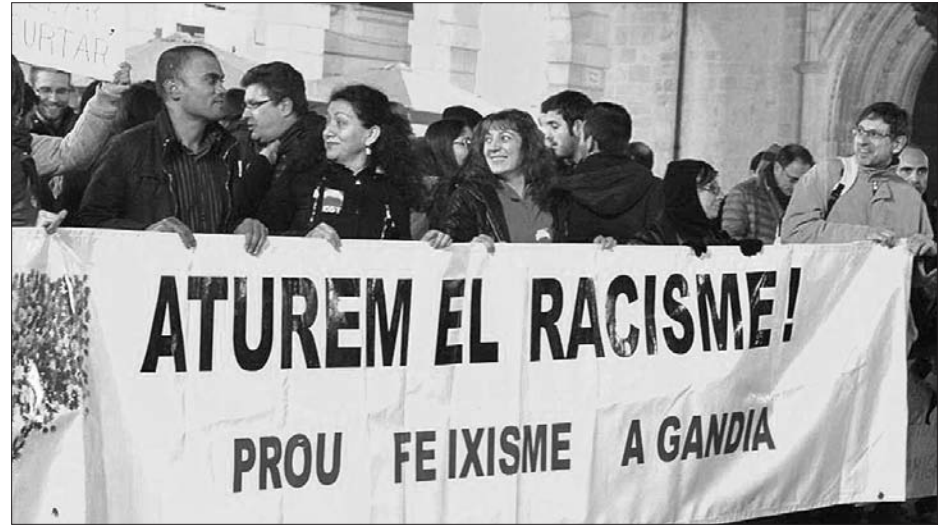
Manifestació convocada per CGT a Gandia contra les declaracions racistes de l'alcalde