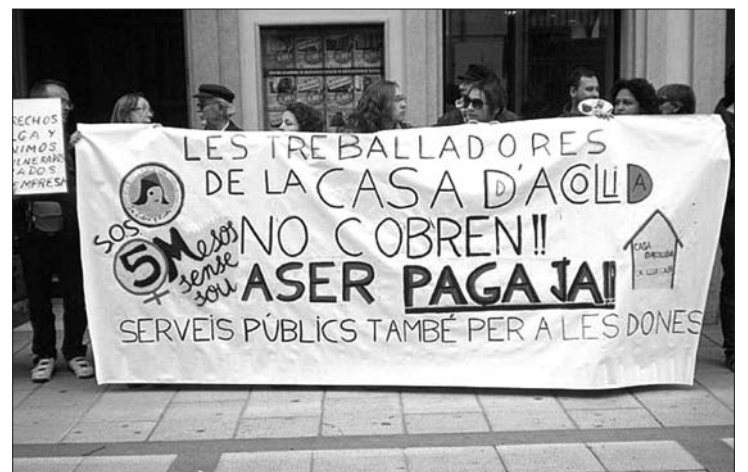
Imatge d'una de les concentracions que tingueren lloc al 2012