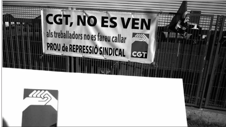
Moment de la concentració a les portes de Greenmed Sollana