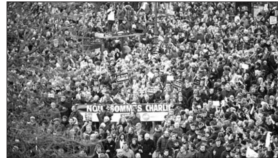
Els líders mundials en la manifestació de París. Aquesta foto mostra el que va ser un muntatge, ells no encapçalaren ni es barrejaren amb els participants de la multitudinària protesta. En la següent imatge, la mani.