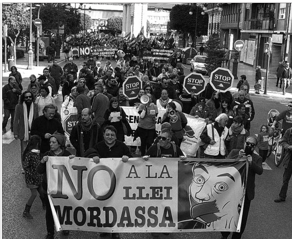
Protesta contra la Llei Mordassa del 25 de gener a València / JUAN RAMÓN FERRANDIS