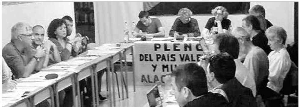
Ple de Sindicats de CGT País Valencià i Múrcia celebrat el 5 d'abril d'enguany en Alacant

Avgda. del Cid 154 baix Tels. 96 383 44 40 46014-València