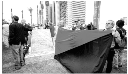
Inauguració monòlit en el jardí Sidi M'Hamed