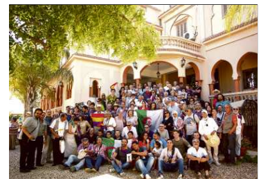
Mostaganem, fundació Djenatu El Arif/PEGATUM TRANSMEDIA

EDITORIAL Un Ple per a tota la militància pàg. 2