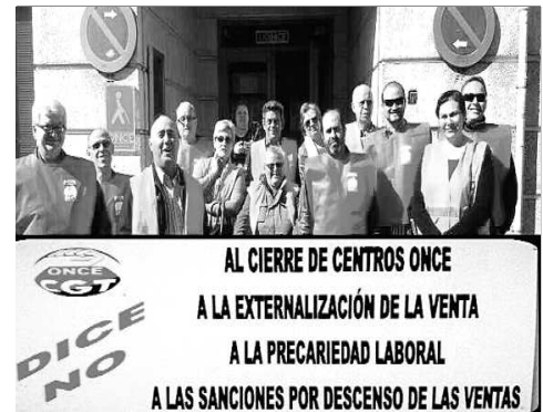
Concentración en Denia

Salut i espere que ens vegem el pròxim any.