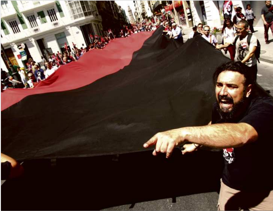
1er de Maig 2014 a València