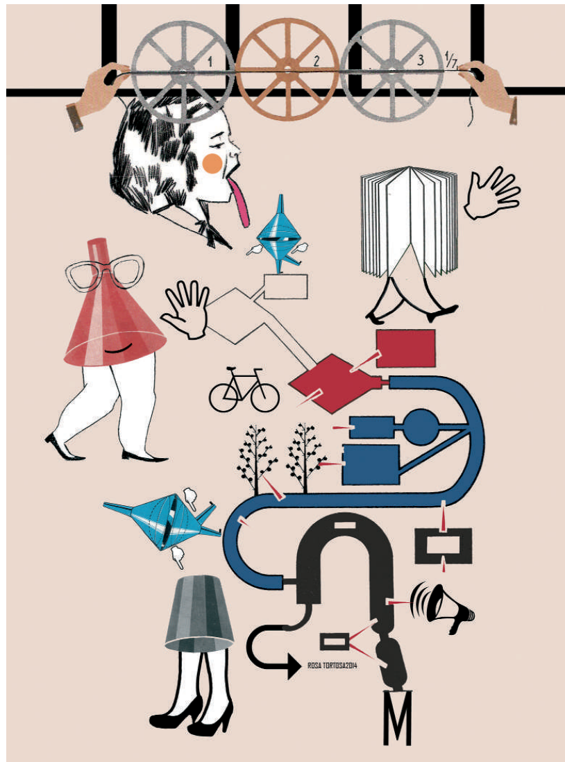
ILUSTRACIÓN: ROSA TORTOSA

La herida que produce el AVE en el territorio a su paso es profunda y dolorosa. Lo fragmenta, y lo polariza de forma perniciosa. Las consecuencias ambientales se dejarán sentir por largos años