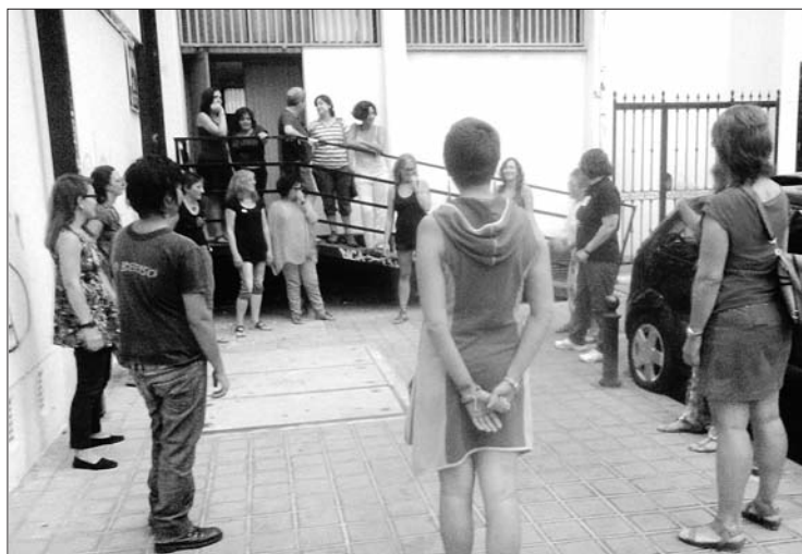
Imatges corresponents a diferents moments dels tallers, a Alacant i València

boral per a comprometre's amb el món a nivell social i llibertari. Des de CGT diem No a l'Estat Opressor, però què és el Patriarcat sinó una altra forma d'opressió de l'estat? Com a anarquistes hem de perseverar en la lluita per una societat en la qual ningú siga dipositari del poder, criden-se bancs, estat, mercats o patriarcat.