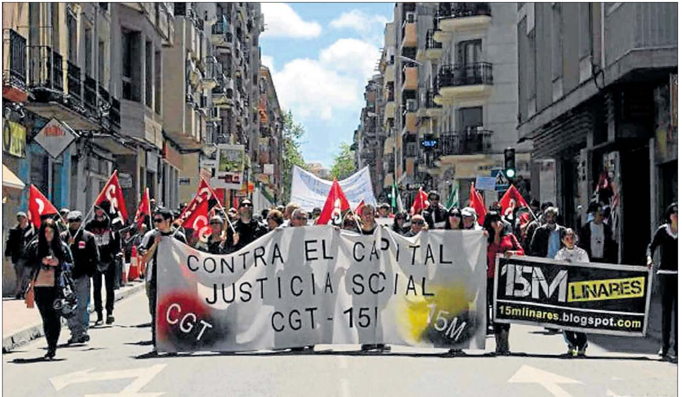
Manifestación del 1º de Mayo en Linares.

Este 1º de Mayo la CGT se movilizó como cada año por todo el territorio andaluz. El agravamiento de la crisis, que ha arrastrado ya a más de 6 millones de personas al paro, casi un millón y medio en Andalucía, animó a miles de personas a llenar las calles para reclamar sus derechos. CGT confluó con otras organizaciones sociales y sindicales en los bloques críticos y manifestaciones alternativas para exigir también al sindicalismo pactista el fin definitivo de la paz social, ya que el ataque frontal a los derechos sociales y laborales que estamos viviendo exige una respuesta clara y contundente.