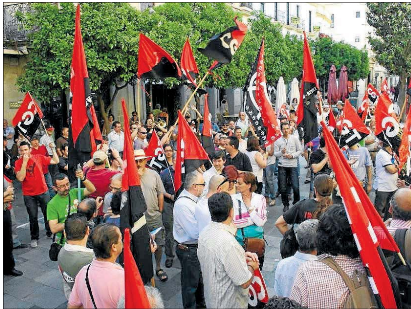
Protesta de CGT contra el ERE de Jerez.