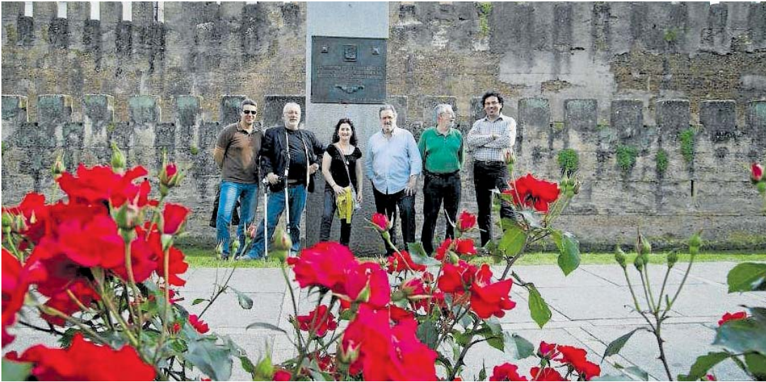
Responsables de la web todoslosnombres.org junto al monolito que recuerda a los fusilados en Sevilla.