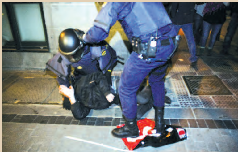
10 F, represión policial, Madrid

LOS RECORTES EN EDUCACIÓN Y SANIDAD, Y LA REFORMA LABORAL HAN CENTRADO LAS LUCHAS DE FEBRERO. LOS PROTAGONISTAS DE LA CALLE, Y LOS PRIMERO EN SUFRIR LA REPRESIÓN DEL ESTADO: LXS ESTUDIANTES.,