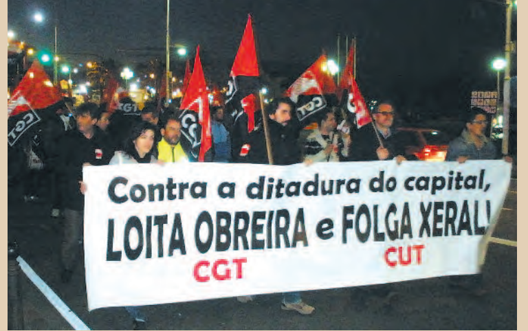
24 F, Manifestación unitaria A Coruña / CGT A CORUÑA