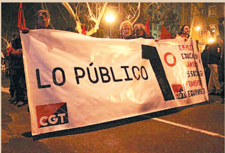
16 F, 3.000 manifestantes en Zaragoza

La Confederación ha participado activamente en las múltiples movilizaciones que se han desarrollado durante el mes de febrero. Aquí hacemos una breve selección cronológica de fotos de estas acciones, destacando las masivas movilizaciones contra la Reforma Laboral del 19 de febrero, y las movilizaciones estudiantiles duramente reprimidas en Valencia y Barcelona.