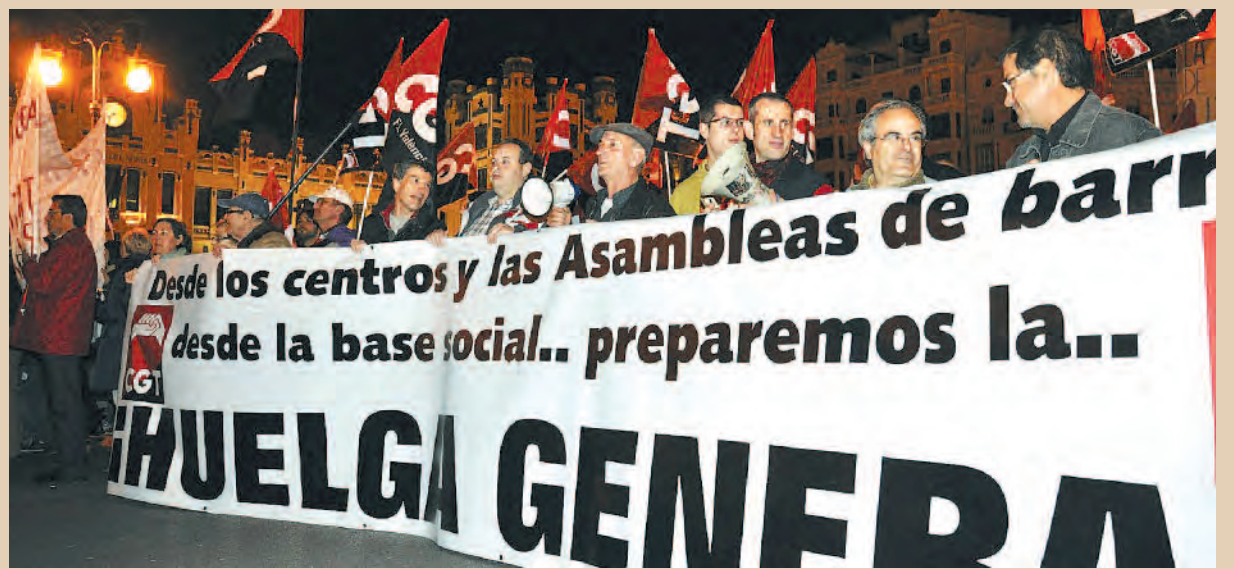
25 F, Manifestación en Valencia / CGT -PV