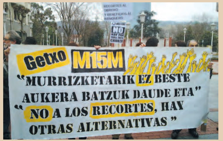
25 F, Manifestación unitaria en Bilbao