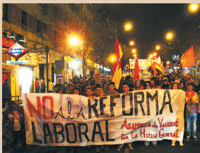
29 F, Manifestación en Vallecas, Mafrir / M.G.