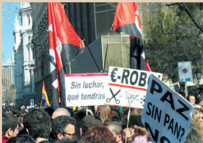
19 F, Manifestación en Madrid / S.S EL ESCORIAL