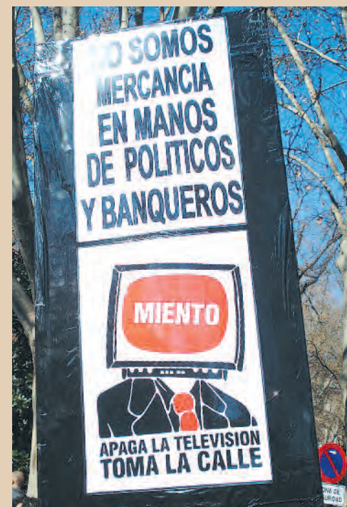
19 F, Manifestación en Madrid