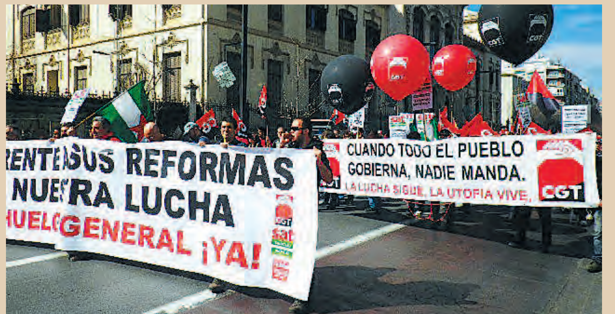
28 F, Manifestación unitaria en Granada / CGT GRANADA