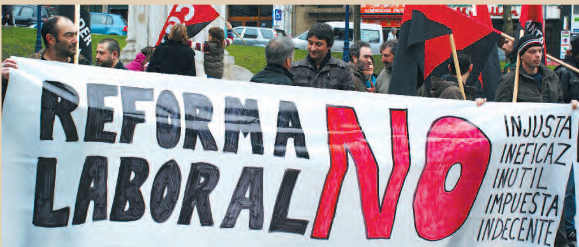
25 F, Manifestación unitaria en Santander