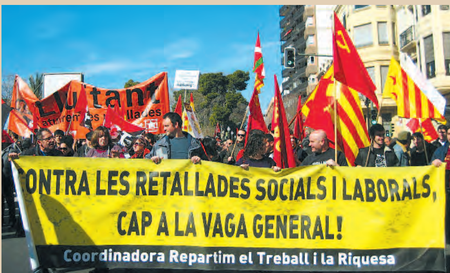
19 F, Manifestación en Castelló