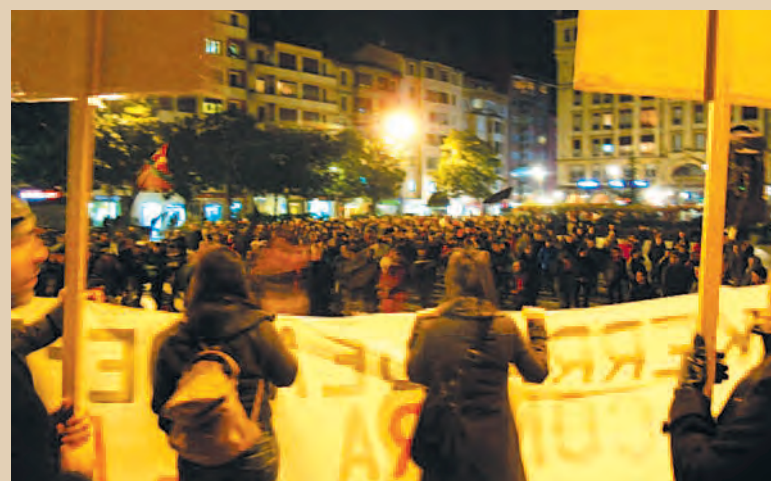
17 F, miles de personas en Barakaldo / BERRI-OTKOAK