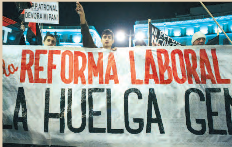
10 F, en Sol contra la Reforma Laboral, Madrid