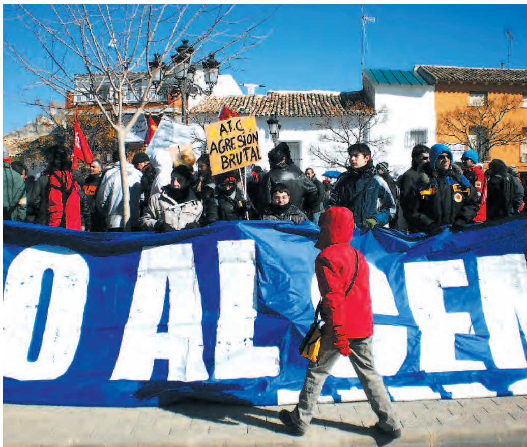
Concentración en Villar de Cañas el 12 de febrero