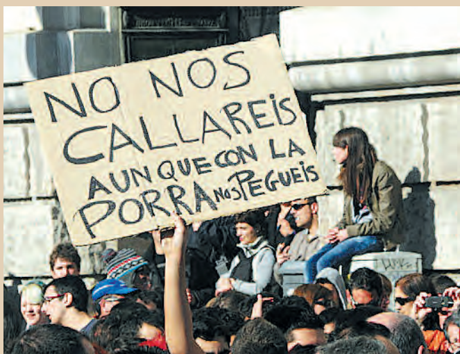
22 F, contra la represión estudiantil en Valencia /