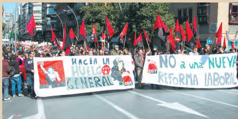
19 F, Parada de CGT en la manifestación de Murcia