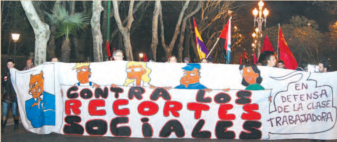
24 F, Manifestación unitaria en Valladolid