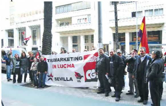
Concentración en Sevilla el 27 de enero