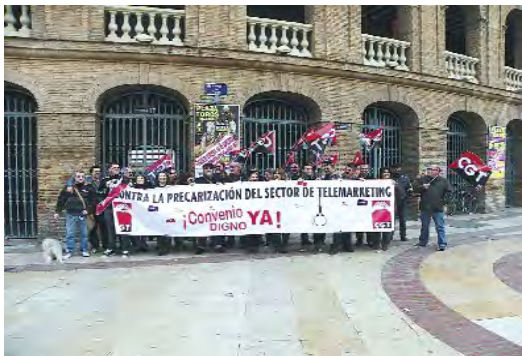
Concentración en Valencia el 12 de enero