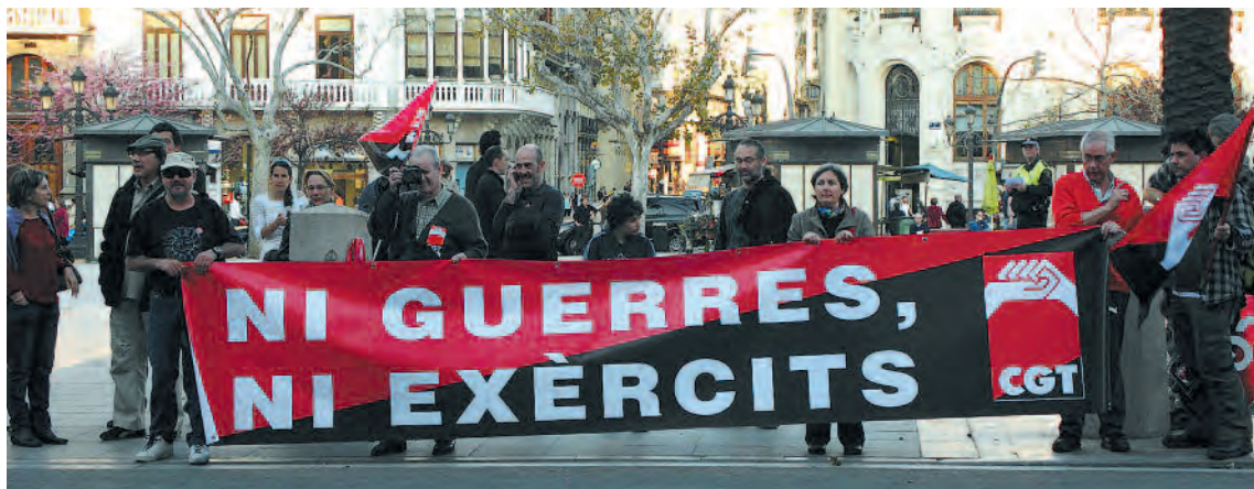
Concentración en Valencia el 31 de Marzo.

N os han metido otra vez en una guerra "humanitaria". Curiosamente, también un 19 de marzo, como hace ocho años. Aunque esta vez al perro le han colocado el collar de una resolución de la ONU, el de Libia es de la misma camada que el de Irak o el de Afganistán: Un régimen tiránico como el de Gadafi, hasta ayer amigo de las potencias occidentales, donde venía a plantar su jaima, con sus camellos y vírgenes, y que ahora también sirve de excusa para un ataque bélico que, sin duda, igualmente tiene unos objetivos ajenos a los de promover la democracia y los derechos humanos.