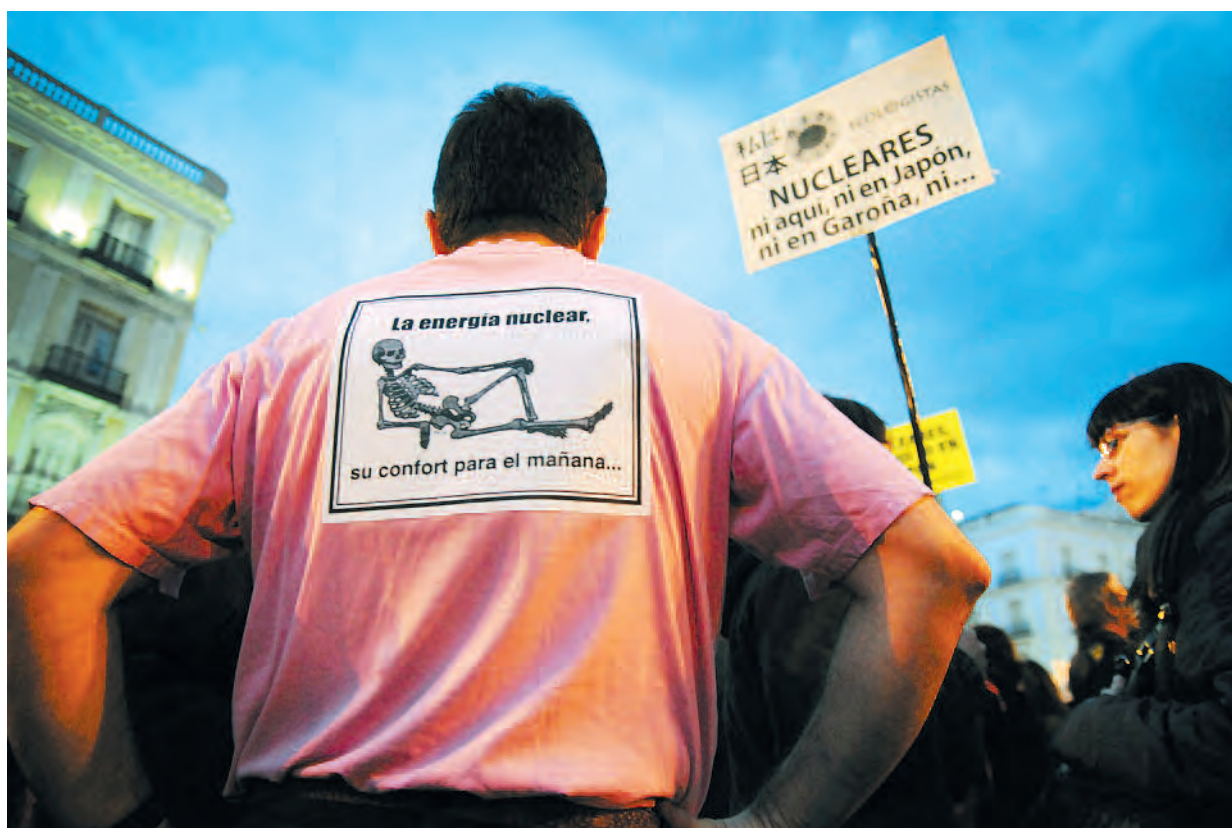
Concentración en la Puerta del Sol de Madrid el 17 de marzo.

Por ello una vez más se ha vuelto a demostrar que las centrales nucleares son inseguras y que los gobiernos siguen sin tener ningún reparo de someter a sus poblaciones a este enorme riesgo para seguir garantizando el beneficio de determinadas compañías eléctricas. Ha vuelto a desenmascarse que esta fuente de energía es potencialmente catastrófica, genera unos riesgos inaceptables y sus residuos son un legado inadmisibles para las generaciones futuras. Una vez más, las mentiras con las que