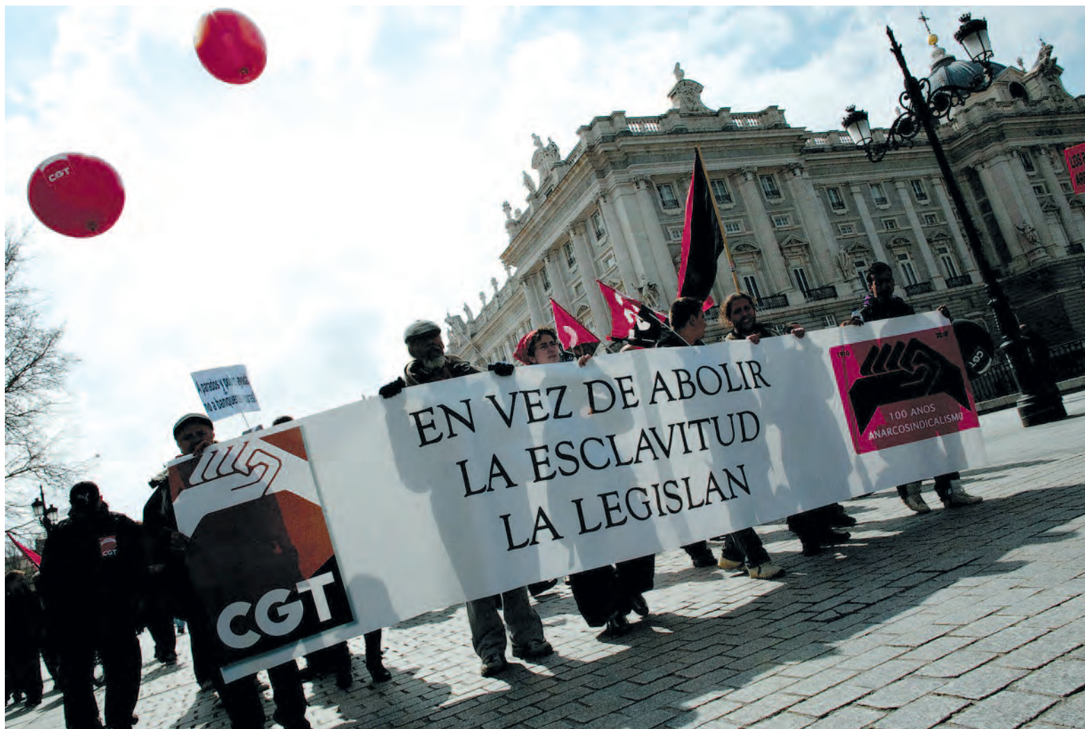
Una de las decenas de pancartas de la CGT a su paso por el Palacio de Oriente, el 12 de Marzo.

En la mañana del 12 de marzo, miles de personas participaron en la manifestación convocada por la Confederación General del Trabajo (CGT), y apoyada por diversas organizaciones sindicales, sociales, políticas e internacionales, contra el Pacto Social, por el reparto del empleo y de la riqueza, la jubilación a los 60 años y la jornada laboral de 35 horas como medidas para crear empleo.