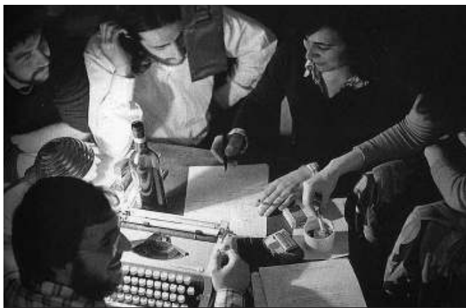
Un dels consells de redacció de l'"Ajoblanco", una revista contracultural que va servir de reflex i de guia alhora per als revolucionaris dels setanta, molts d'ells de la nova CNT.