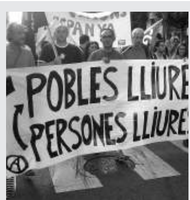
Manifest del Bloc Negre per un onze de setembre llibertari