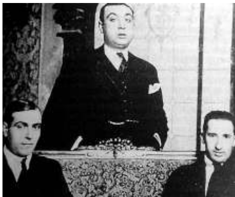
Anselmo Lorenzo (a l'esquerra) i Salvador Seguí (a dalt) són només dos dels noms dels sindicalistes anarquistes que van participar en la creació de Solidaridad Obrera. Aquest congrés se celebrà a la capital de Catalunya, Barcelona, els dies 6-8 de setembre de 1908, constituint-se llavors la Confederació Regional de Societats de Resistència-Solidaritat Obrera, amb 153 delegats que representaven 95 societats federades i quatre federacions locals.