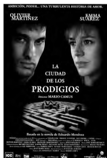
LA CIUDAD DE LOS PRODIGIOS Mario Camus (1999) Basada en l'obra d'Eduardo Mendoza, presenta l'ascens d'un home sense escrúpols en el marc d'una Barcelona de tensions polítiques i sindicals al tombant de segle.