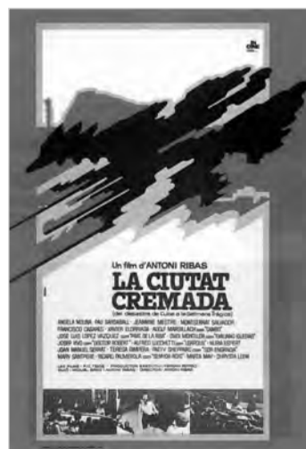
LA CIUTAT CREMADA Antoni Ribas (1975) Pel·lícula mítica del cinema català de la represa després de la dictadura franquista. És un fresc de la història de Barcelona des de la Guerra de Cuba fins la Setmana Tràgica. Catalunya. Setembre de 2009