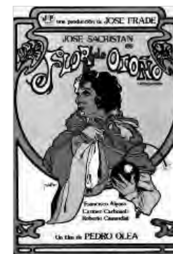
UN HOMBRE LLAMADO FLOR DE OTOÑO Pedro Olea (1978) Durant la dictadura de Primo de Rivera, un advocat sindicalista es represaliat per actuar transvestit en un espectacle de cabaret.