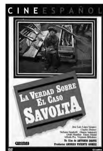
LA VERDAD SOBRE EL CASO SAVOLTA Antonio Drove (1979) Una altra adaptació de l'escriptor Mendoza. Narra el cas d'un assassinat polític en l'àmbit del sindicalisme espanyol dels anys vint.