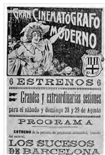
LOS SUCESOS DE BARCELONA Josep Gaspar (1909) Un dels pioners del cinema català filma els fets de la Setmana Tràgica i causa una gran commoció popular durant la seva exhibició. Actualment es dona per perduda.