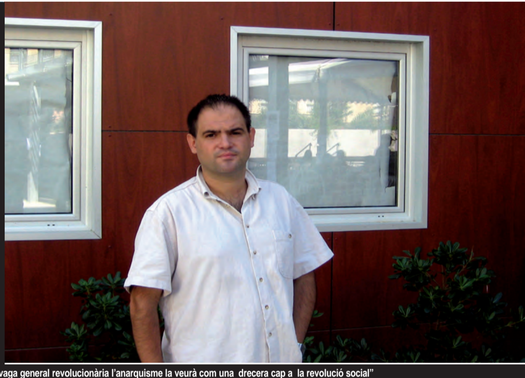
"La vaga general revolucionària l'anarquisme la veurà com una dreuera cap a la revolució social"

"Anarquistes, socialistes i republicans compartien una visió força negativa de l'Església"