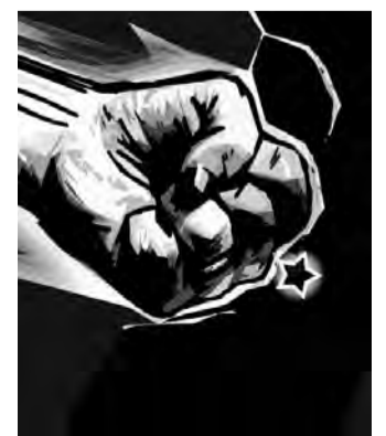
Catalunya. Setembre de 2009

- Punt 5: Acció Social de la CGT de Catalunya. - Punt 6: Estatuts. - Punt 7: Elecció i nomenament de: * Components de la Comissió de Garanties. * Components de la Comissió Econòmica. * Components de las diferents secretaries del Secretariat Permanent. * Coordinador/a del Catalunya.