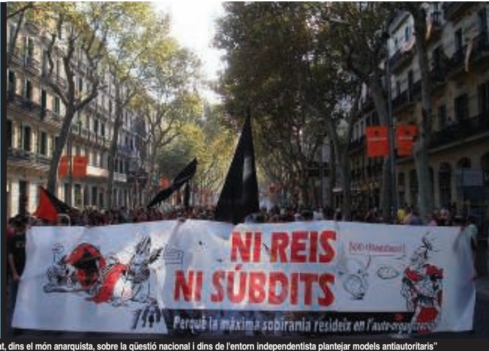
"Pretenem fomentar el debat, dins el món anarquista, sobre la qüestió nacional i dins de l'entorn independentista plantejar models antiautoritaris"