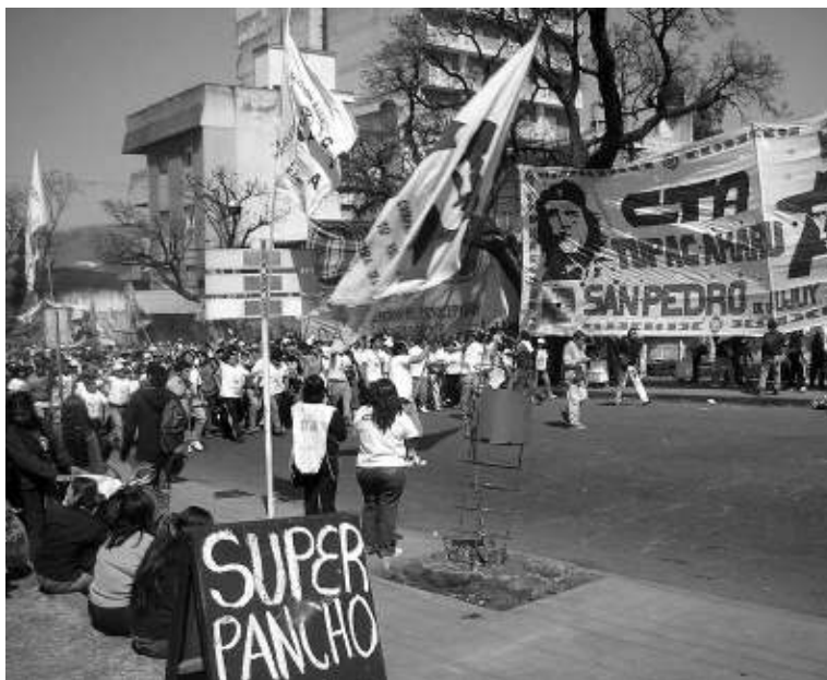
(barris marginals de la perifèria de Buenos Aires), cooperatives de treball i associacions barrials, com la Tupac Amaru de Jujuy.

Dins la variada configuració de moviments de tot tipus que conformen aquest curiosa central, el sindicat amb més afiliació és l'Associació de Treballadors Estatals (ATE), àmpliament majoritària al sector, però dins la mateixa estructura de la CTA es coordinen, entre molts d'altres, el Movimiento Nacional de los Chicos del Pueblo, que agrupa els nens que viuen al carrer sense cap recurs, moviments indigenistes com el de la Província del Chaco, Federacions de "villas miserias"