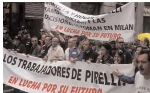
Catalunya. Novembre de 2008

planteja quatre possibilitats per a l'excedent de plantilla: recol·locacions en altres empreses del grup, recol·locacions externes mitjançant la contractació d'una empresa de reinserció laboral, prejubilacions per a treballadors de 58 anys o més i indemnitzacions. Els treballadors de Pirelli hauran de valorar ara les condicions proposades per l'empresa en una assemblea general a la qual assistiran els assessors legals dels sindicats representats al comitè.