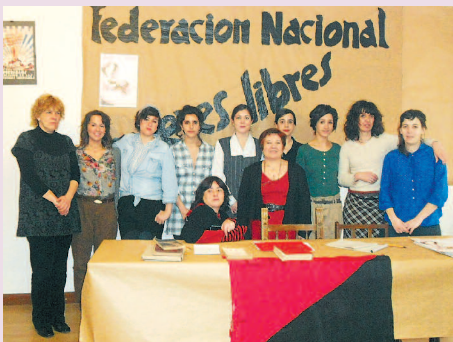
Las actrices con militantes de CGT