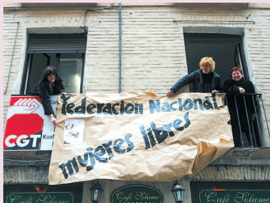
Mujeres libres de Iruña