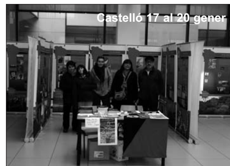
Castelló 17 al 20 gener