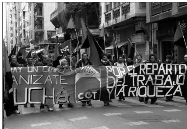
Marxa pels Drets Socials a València el 27-N