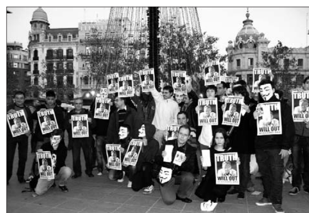
Per la llibertat d'expressió, FreeWikileaks. 8-G València