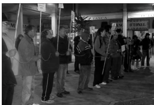
Marxa d'esclaus el dia de la Vaga de Consum en Alfafar, 21-D