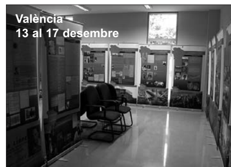
València 13 al 17 desembre