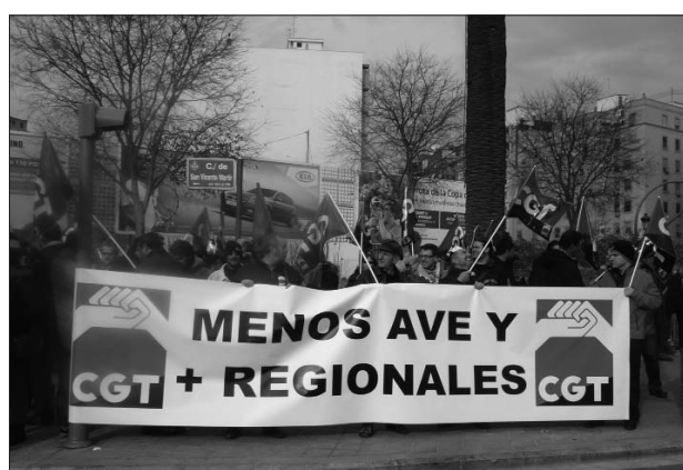
Concentració el 18-D, inauguració de l'AVE Madrid-València