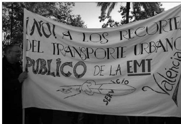
26-N: Contra la privatització i les retallades dels autobusos EMT

Des de l'última edició del NC, les mobilitzacions convocades per la CGT o en les que el sindicat ha participat han sigut molt nombroses. Les marxes per la dignitat d'Alacant, la marxa d'esclaus en Alfafar, la Vaga de Consum del 21-D, les protestes, concentracions i manifestacions contra la reforma laboral a Castelló, Alacant i València, concentracions per la llibertat d'Assange (WikiLeaks), concentració per un ferrocarril públic el dia de la inauguració de l'AVE Madrid-València, marxes pel tancament dels CIE, debats i xerrades en casals, associacions de veïns, més mobilitzacions contra la recent reforma de les pensions i el pacte social... L'activitat s'ha fet sentir, estem ahí. A continuació, algunes imatges de les mobilitzacions.