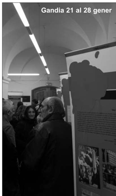
Gandia 21 al 28 gener