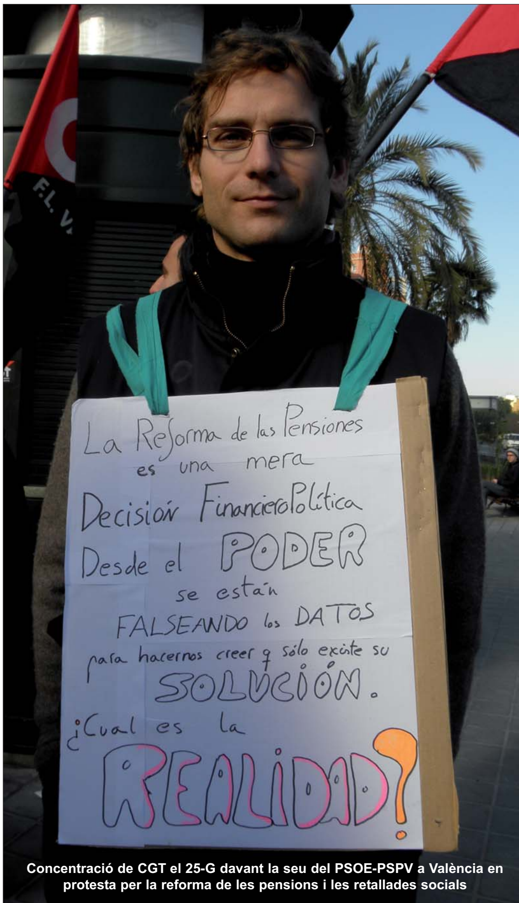
Concentració de CGT el 25-G davant la seu del PSOE-PSPV a València en protesta per la reforma de les pensions i les retallades socials

Para quan la ràbia i la impotència es traslladen al carrer, que es traslladaran, els diferents col·lectius llibertaris haurem d'estar a l'altura de les circumstàncies i dotar d'eines i continguts les lluites i mobilitzacions com històricament sempre hem fet, d'altra banda. De moment ací estem, amb dignitat i responsabilitat, sent 100 o milers, convocant i participant en tot un seguit d'actes reivindicatius. Ací estem i estarem.