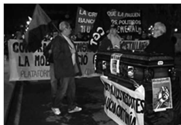
27-G Alacant: Contra la reforma de les pensions