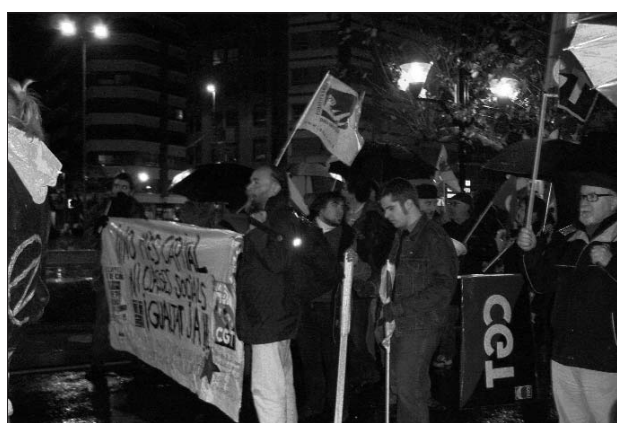
27-G Castelló: Contra la reforma de les pensions