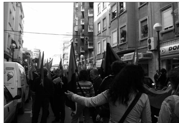
11-D: Marxa per la Dignitat en Alacant