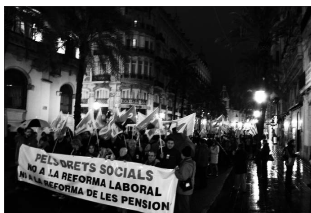
27-G València: Contra la reforma de les pensions