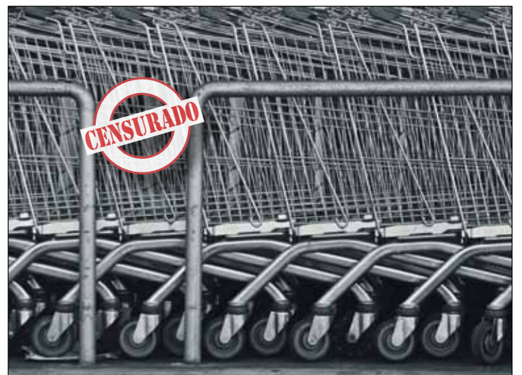
Los carros vacíos pueden herir la sensibilidad de los mercados

Simplemente delirante, en su fondo y en las formas (cortijeras, oscurantistas, tramposas). La Administración Pública y el patrimonio común como botón de guerra electoral y al servicio del capital. ¡Hay que pararlos los pies antes de que arrasen con todo! ¡Continuemos con las movilizaciones!