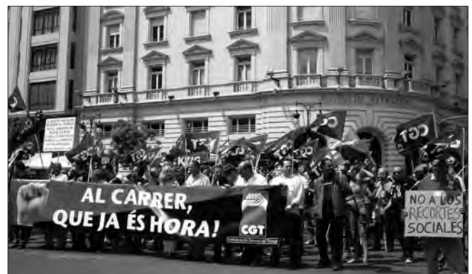
CGT VALÈNCIA: I la lluita es du a terme portant al carrer les reivindicacions dels treballadors que no volem pagar la crisi d'un sistema fallit i sense eixida