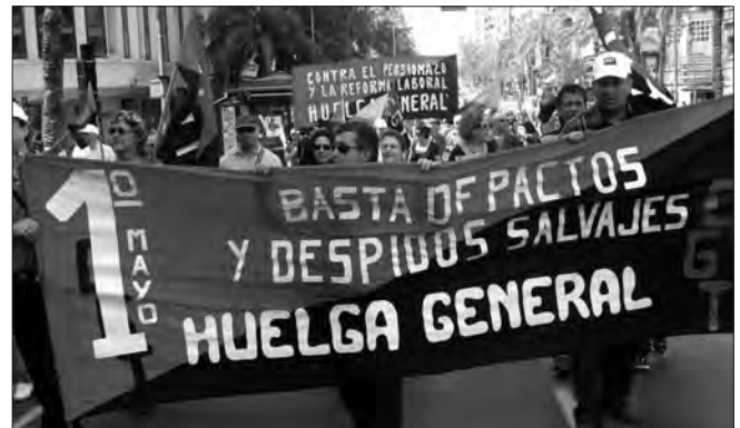
CGT ALACANT: Com mostra la foto, la Vaga General com a resposta a la situació de precarietat i explotació laboral va ser la reivindicació principal en el 1er de Maig