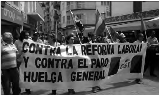
CGT BENIDORM: Enguany CGT i l'Assemblea d'Aturats van recuperar la manifestació del Dia Internacional de la Classe Treballadora en la Marina Baixa

Si vols saber més www.cgt.org.es i www.rojoynegro.info