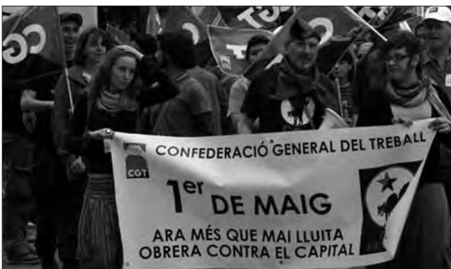
CGT CASTELLÓ: Les retallades imposades pel govern i la UE, instruments del capitalisme en crisi, es responen amb la ara més que mai imprescindible lluita obrera