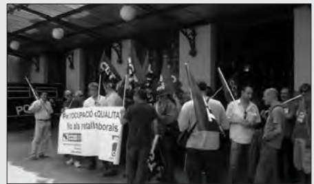
CONCENTRACIÓ SFF-CGT PROTESTA PER LA PRECARITZACIÓ LABORAL EN RENFE I ADIF El 25 de maig en València, CGT i CCOO es concentraren, abans la vaga del 28-m, contra la firma de l'Acord de Desenvolupament Professional