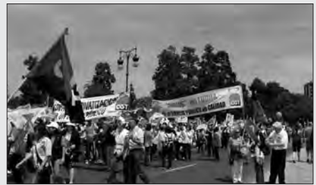
VAGA ESTATAL I MANIFESTACIÓ EN VALÈNCIA Els empleats de Correus estan en plena mobilització en contra de la liberalització del sector postal i de la privatització de l'empresa pública. A la mani de València acudiren, el passat 29 d'abril, milers de treballadors de tot l'Estat