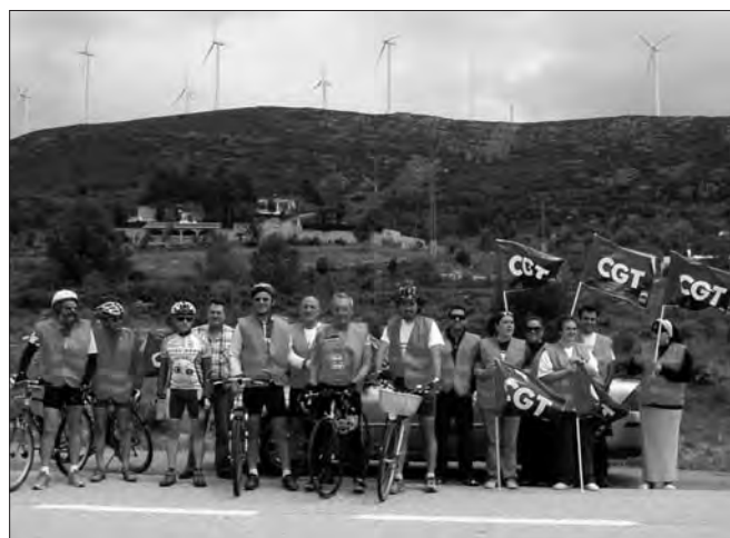
De dalt a baix i d'esquerra a dreta: Caravana contra l'atur i l'exclusió social de San Joan a Alacant, Ruta de la precarietat pel centre de València assenyalant els punts negres de la crisi, Marxa contra la crisi i l'atur de Silla a Alfajar, Marxa ciclista contra la crisi de València a Madrid i, finalment, Gran Manifestació Unitària a Madrid contra el Capitalisme i la UE. Maig del 2010.