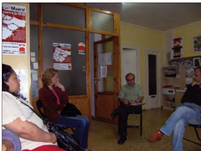
Dalt, companys de La Safor en la manifestació del 1er de Maig a València. Baix, reunió on participava el secretari general de CGT-PV, celebrada en el local de Gandia.

zems de fruites i taronja, construcció, etc. es continua treballant en negre o en precari, amb unes condicions laborals d’abús i esclavitud; emparant-se en la crisi molts retallen els horaris en el contracte laboral, (menys costos per a l’empresari) però les jornades continuen sent les mateixes.