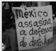
ORGANITZACIONS ASSENYALEN EL GOVERN MEXICÀ I LA UE El silenci mediàtic i la falta de condemna ha encobert els dos assassinats perpetrats per paramilitars mexicans que feren una emboscada a una caravana solidària en Oaxaca