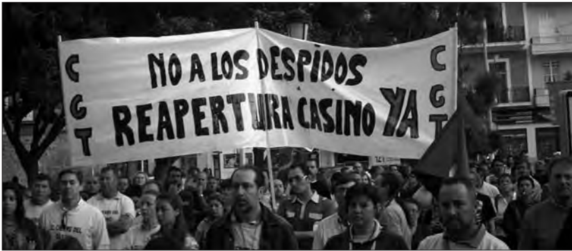
LA VILA: Milers de ciutadans van eixir al carrer el 30 d'abril per a recolzar la lluita dels treballadors del Casino contra els acomiadaments i el tancament de la sala. CGT defén que l'ERO no està justificat i tampoc el tancament del Casino