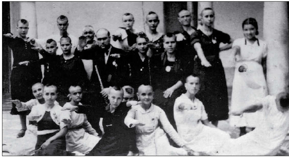
Mujeres y jóvenes en el patio interior del Ayuntamiento de Montilla (Córdoba), a principios de agosto de 1936: peladas por los derechistas y obligadas a saludar al estilo fascista. Fotografía que ilustra la portada del libro “Los puños y las pistolas”, de Arcángel Bedmar.

Se trata, en primer lugar, de reconocerlas oficialmente como tales víctimas. No debe ser, en ningún caso, una coletilla con la que cerrar los capítulos represivos o quedar subordinada a “la represión de verdad”. Se trata de entender el significado profundo de la violencia ejercida sobre las mujeres, “en femenino plural” (en expresión de Pura Sánchez, autora de Individuas de dudosa moral: 2009), como parate sustancial del ejercicio de poder absoluto, en todos los órdenes de la