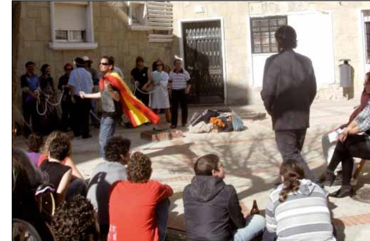
Interpretación de Mercado de esclavos. http://bahiadecadiz.contralacrisis.wordpress.com

En la asamblea, además de la CGT, estaban presentes los centros sociales "Casa Yoga" y La Fabrika, la Asamblea de Estudiantes, la