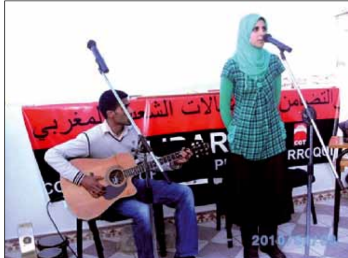
El sábado 3, la música y la poesía sirvieron de puente para el objetivo fundamental del encuentro.