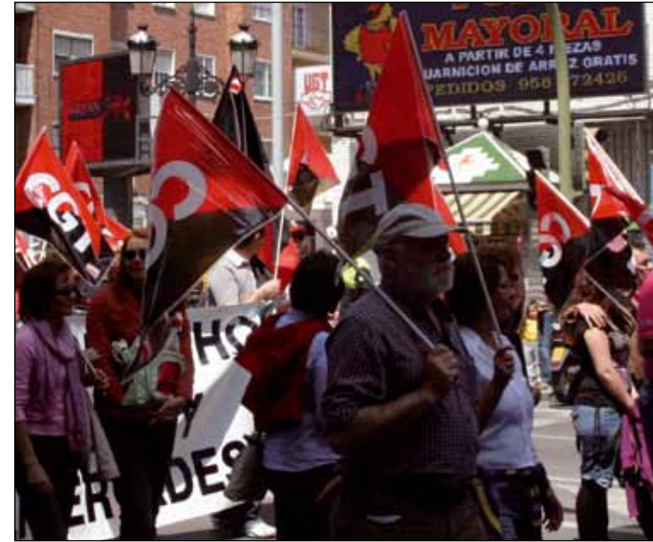
Manifestación de CGT en el Campo de Gibraltar.

Sin embargo, la realidad de la crisis sigue estando ahí, cada día más presente, con un continuo y, en apariencia, imparable deterioro de