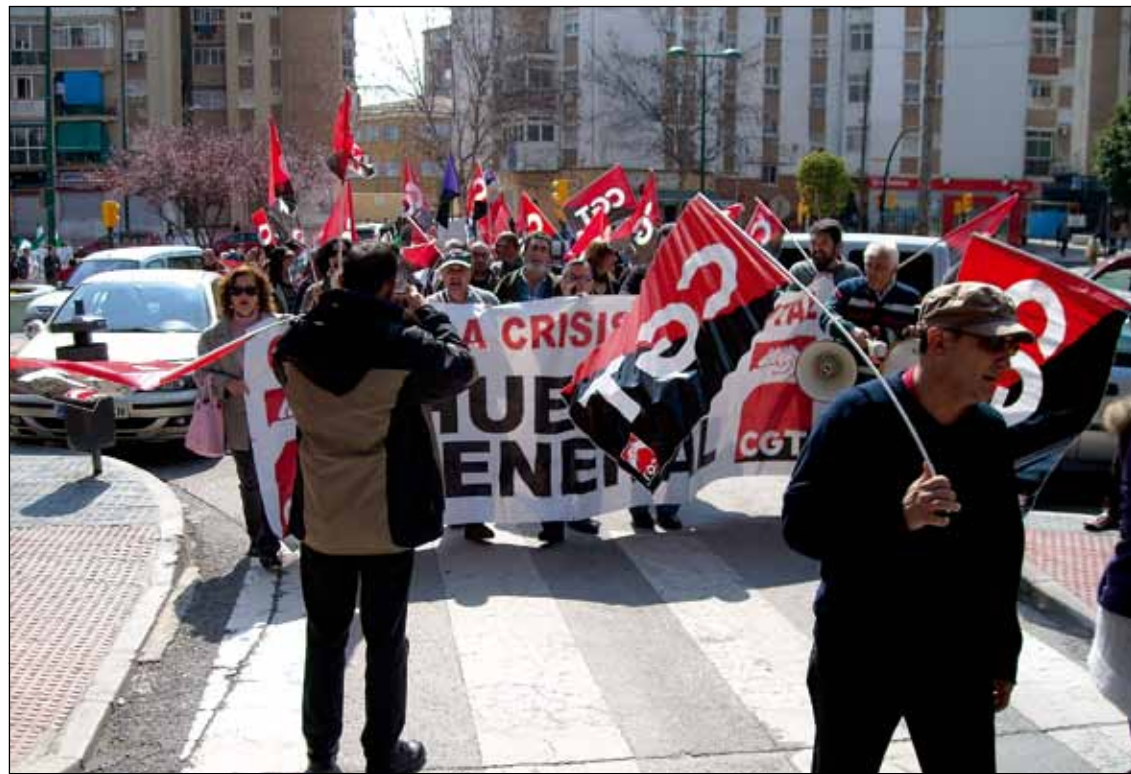
Manifestación en Málaga.

MÁLAGA ▶ Los actos convocados por CGT en Málaga han sido sistemáticamente prohibidos por el Subdelegado del Gobierno