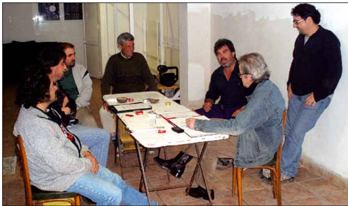
Los compañeros del SP de Oficios Varios y de la Sección del Ayuntamiento en una reunión orgánica.