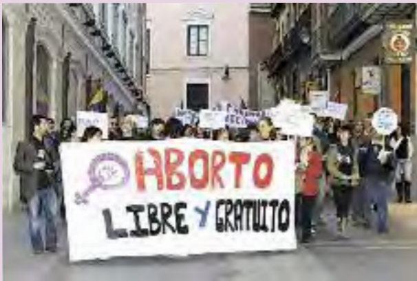
Arriba: Manifestación unitaria en Valladolid el 17 de octubre, por la despenalización del aborto. / ALEX. Abajo: Concentración de CGT Murcia el 26 de octubre en la Pza. de la Universidad. / FL MURCVIA.