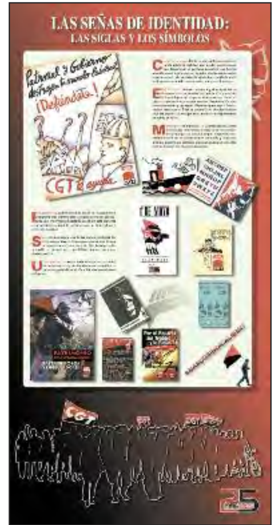
Dos reproducciones de los 23 paneles de que consta la exposición que acompaña como síntesis gráfica al libro "25 años del Congreso de Unificación". Arriba la Portada y a la derecha el panel número cuatro.