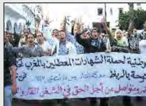
Escenas de la marcha en Rabat. / ANDCM

Información de la ANDCM, Traducción libre del árabe por CGT-A