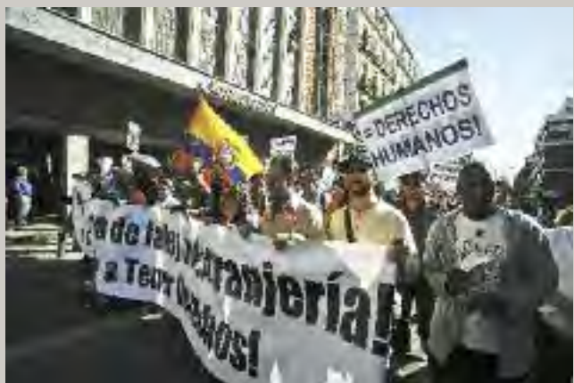
Distintos momentos de la Manifestación convocada por la REDI en Madrid el pasado 17 de octubre.