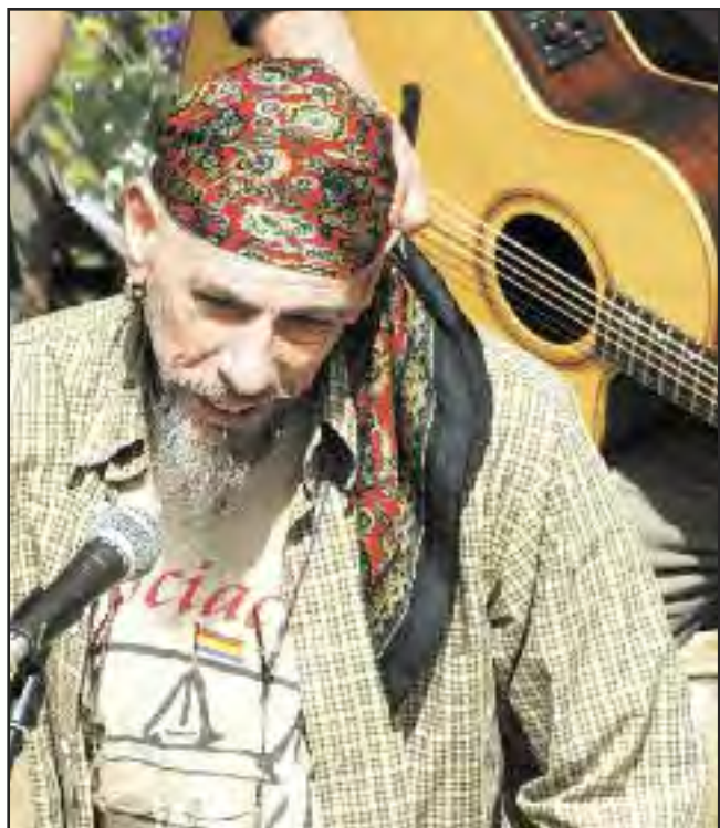
Actuando en el Homenaje a los presos de Ezkaba, Navarra.

DERECHOS SUSCRIPTORES: De acuerdo con la Ley Orgánica 15/1999 de Protección de Datos de carácter personal la Confederación General del Trabajo informa: a) Los datos personales, nombre y dirección de los suscriptores son incorporados a un fichero automatizado, debidamente notificado ante la Agencia de Protección de Datos, cuyo titular es el Secretariado Permanente de la CGT, y su única finalidad es el envío de esta publicación (Rojo y Negro). b) Dicha base de datos está sometida a las medidas de seguridad necesarias para garantizar la seguridad y confidencialidad en el tratamiento de los datos de carácter personal señalados. c) Todo suscriptor directo al Rojo y Negro podrá ejercer sus derechos de acceso, rectificación, cancelación y oposición al tratamiento de sus datos personales mediante comunicación remitida al Secretariado Permanente de la CGT, a la dirección electrónica envíos@rojonynegro.info o a calle Sagunto, 15, 1º, 28010 Madrid. d) Si la suscripción a la publicación Rojo y Negro conforme a su condición de afiliado/a a la CGT el responsable del tratamiento de los datos de carácter personal es el sindicato territorial al que se encuentre afiliado/a siendo este el encargado de ejecutar sus derechos de acceso, rectificación, cancelación y oposición.