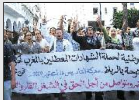
Escenas de la marcha en Rabat.

Información de la ANDCM, Traducción libre del árabe por CGT-A