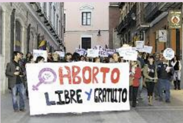
Arriba: Manifestación unitaria en Valladolid el 17 de octubre, por la despenalización del aborto. Abajo: Concentración de CGT Murcia el 26 de octubre en la Pza. de la Universidad.