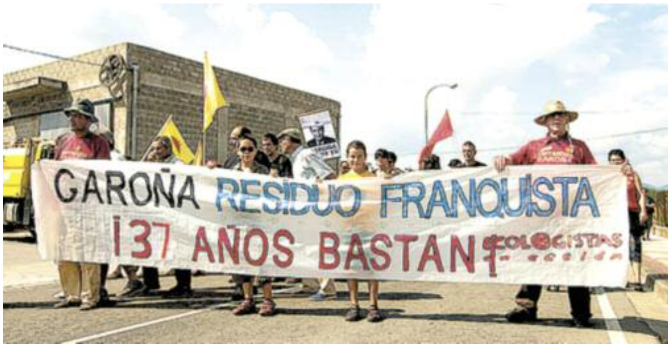
Marcha contra Garoña 2008.