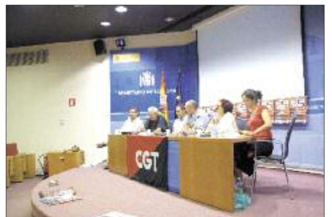
Mesa "Las claves para el futuro". / CARTER.