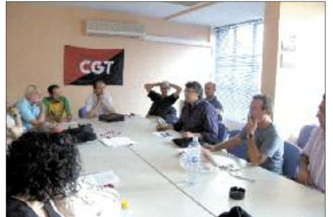
Reunión del Comité Confederal a media mañana.

Un largo centenar de personas desfilaron por los distintos actos de ese día, sabiendo de antemano que este recordatorio va más allá de una mera celebración, por cuanto estos 25 años han hecho de la CGT una realidad viva, contestataria, rebelde, solidaria y libertaria en permanente construcción y diálogo con la dura realidad del capitalismo dominante.