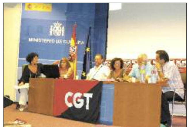
Mesa "Conclusiones sobre el proyecto CGT".