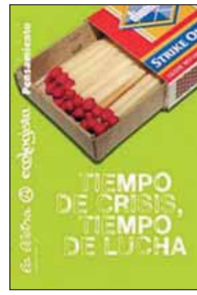
Nº Extra, marzo 2009. 66 pp. 3 €.