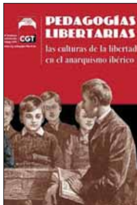
Fed. de Enseñanza CGT, 2009. 36 pp.