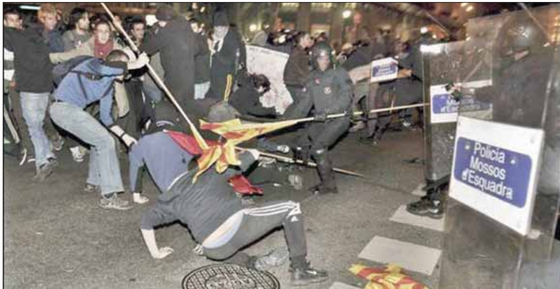
Carga de los mossos en la manifestación de las 20:00.

Está claro que la actuación policial del 18 de marzo no responde a la actitud individual de algunos miembros de las fuerzas policiales, por el contrario la actuación policial ha estado perfectamente planificada desde las cúpulas policiales y gubernamentales catalanas.