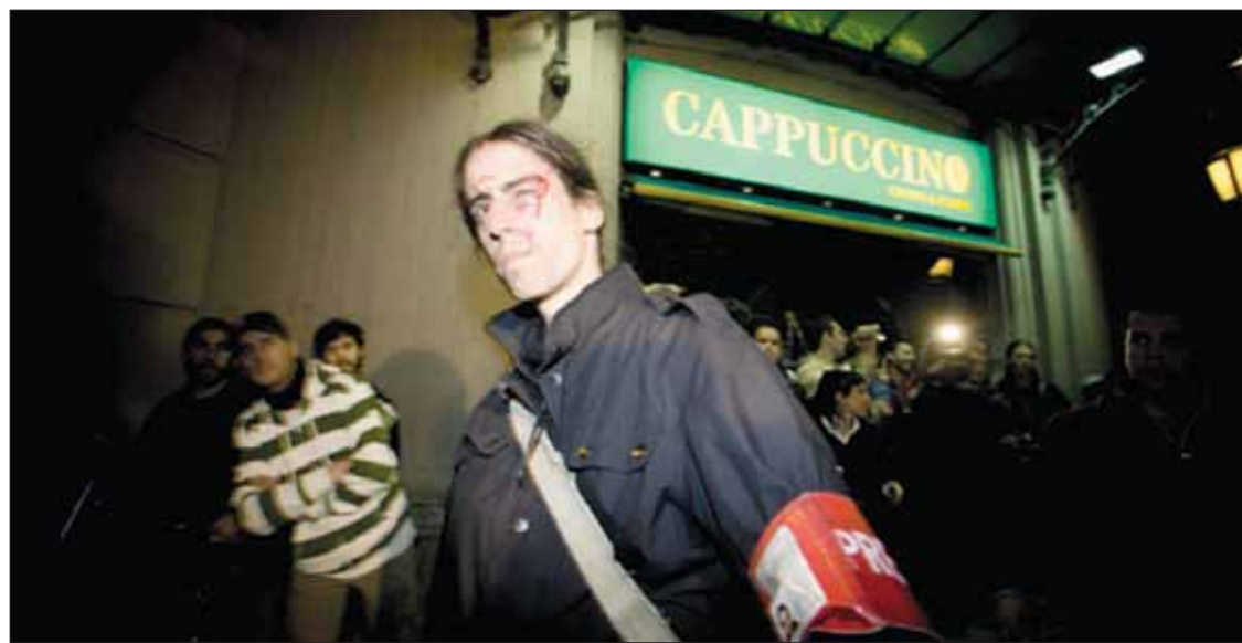
Fotógrafo agredido por los mossos.