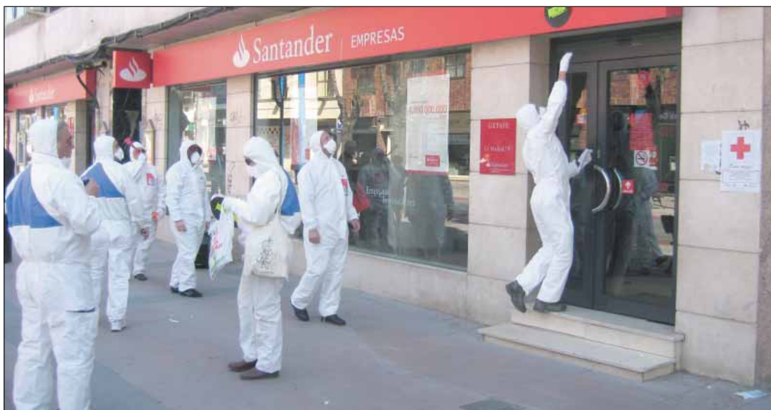
Momento de la acción.

Por la devolución de los dineros públicos, por la gestión pública de bancos e industrias, por el cam-