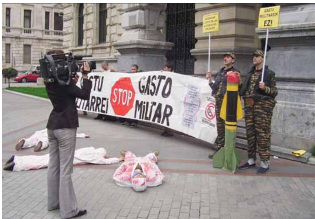
Haciendo OFGM mostramos el rechazo social que tiene el gasto militar.

Más información sobre Objeción Fiscal: http://www.nodo50.org/tortuga/Campana-contra-el-Gasto-Militar , http://www.nodo50.org/objecionfiscal/ , http://www.pangea.org/juspau/siof/equeeslof.htm .