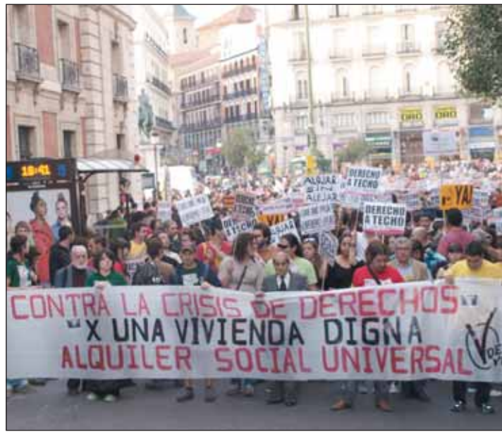
La manifestación, subiendo por calle Carretas.

Exigimos que la ciudadanía sea quien decida todo lo que deba ha-