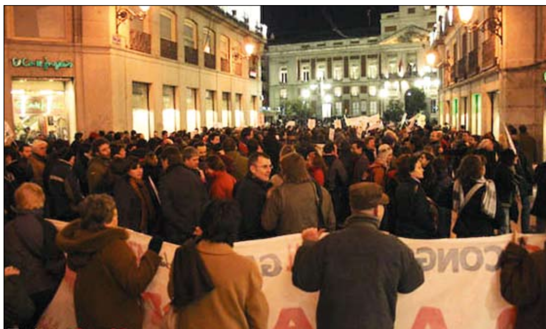
La manifestación, a su llegada a la Puerta del Sol.

Al día siguiente, se celebró la asamblea de clausura del II Foro Social Mundial de Madrid. Las 93 organizaciones que han participado en el encuentro desde el jueves al domingo la eligieron "para poner en práctica la esencia del foro: llevar lo global a lo local y dar voz a los excluidos", según explicó a los me-