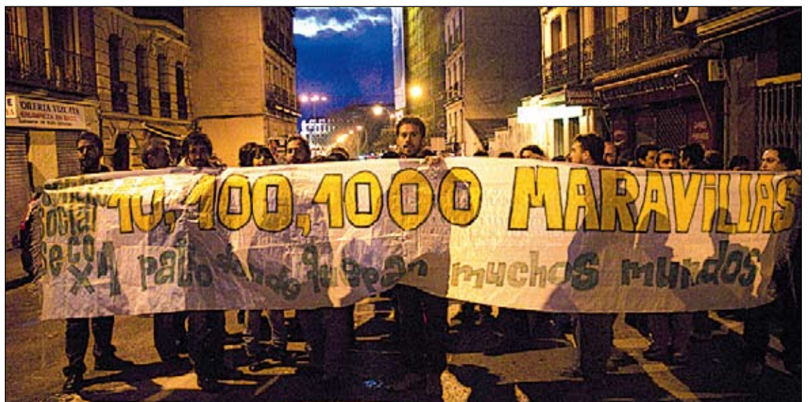
Manifestación de apoyo al Patio el 31 de enero.