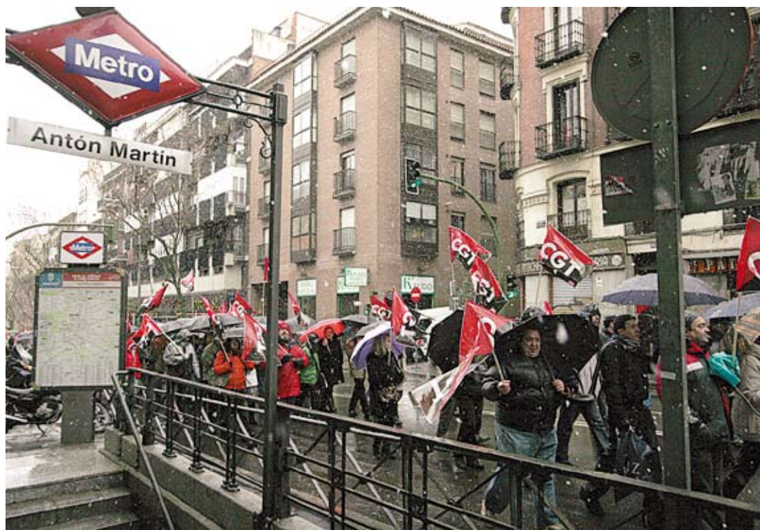
Manifestantes bajo la nieve en Madrid.