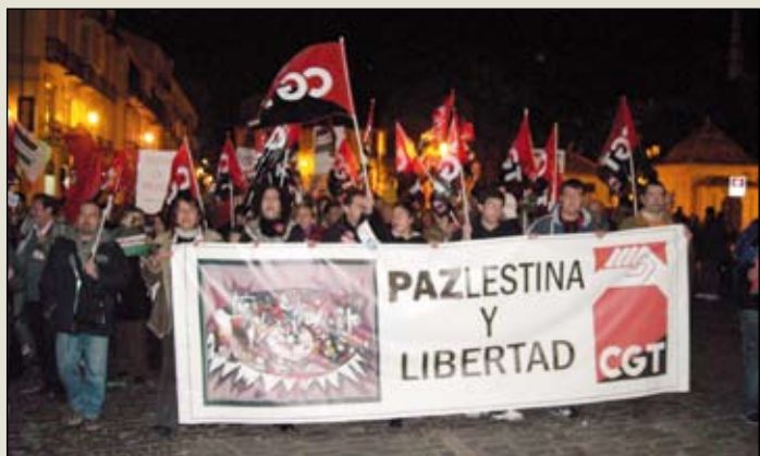
Málaga, en apoyo a Gaza.