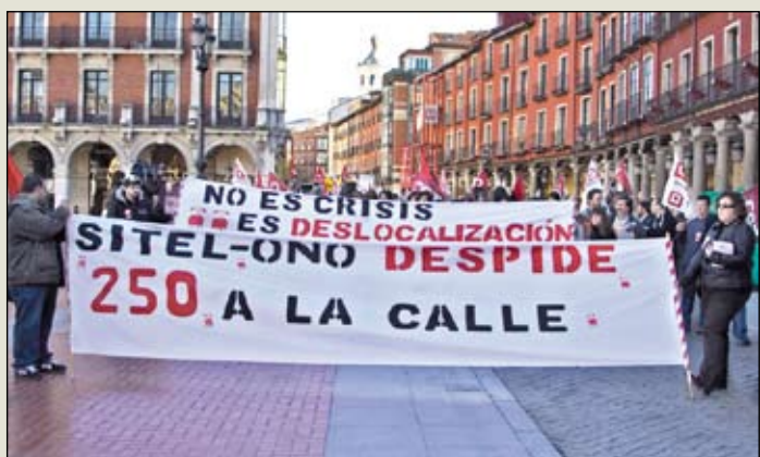
Contra los despidos en Sitel.