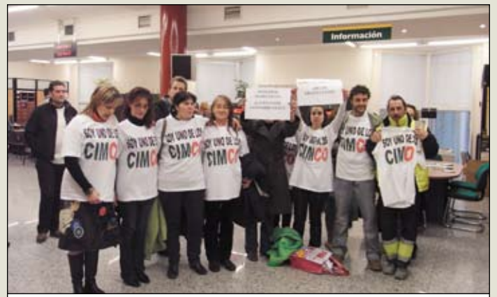
En el Ayto. de Collado-Villalba. CGT ADMON. PÚBLICA MADRID