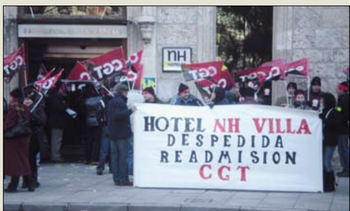
En Burgos, por la despedida en NH.