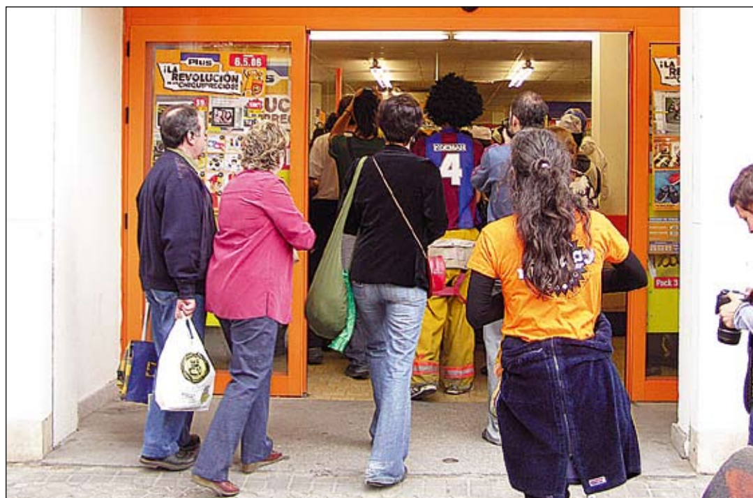
Entrada de los activistas al supermercado en la acción por la que inculpan a los compañeros.

El 29 de abril de 2006 expropiamos públicamente productos de 1ª necesidad como acto de protesta ¿Pretenden acaso que nos arrepintamos por un acto de dignidad? ¿Es que no nos ven? Estamos en los CIEs, en los cuartos de la limpieza de las grandes compañías, en las recepciones de los hoteles, en las barras de los bares, en los andamios, en los supermercados, en las plataformas telefónicas, en las colas del SAE, en los formularios de las ETTs. Somos la generación que nunca tendrá estabilidad. Somos la generación que se fuga, que no quiere resignar-