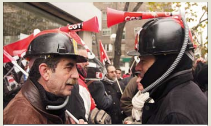
Ferrovianos frente a ADIF. D.F.