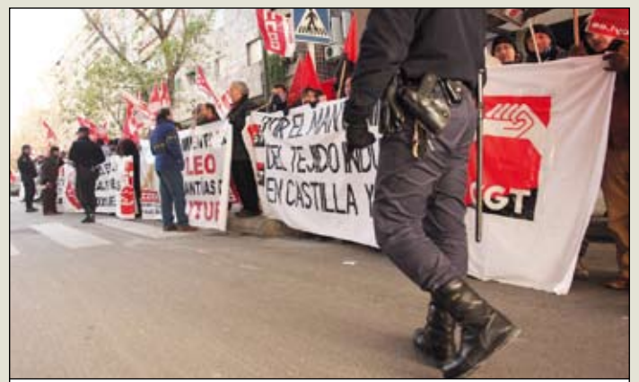
Concentración en Madrid de Renault.