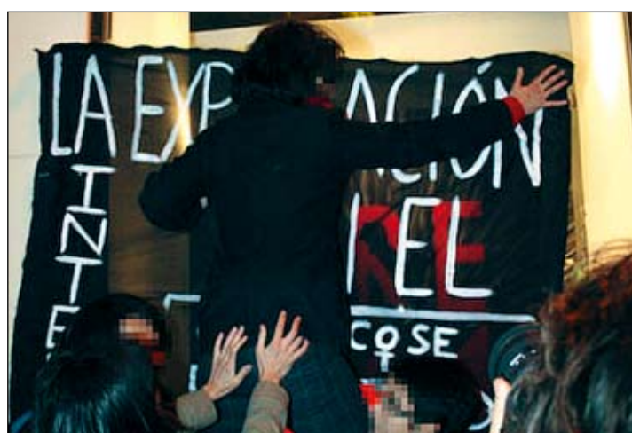
Acción en Zara.