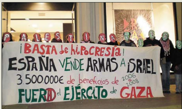
Murcia, también con Gaza.