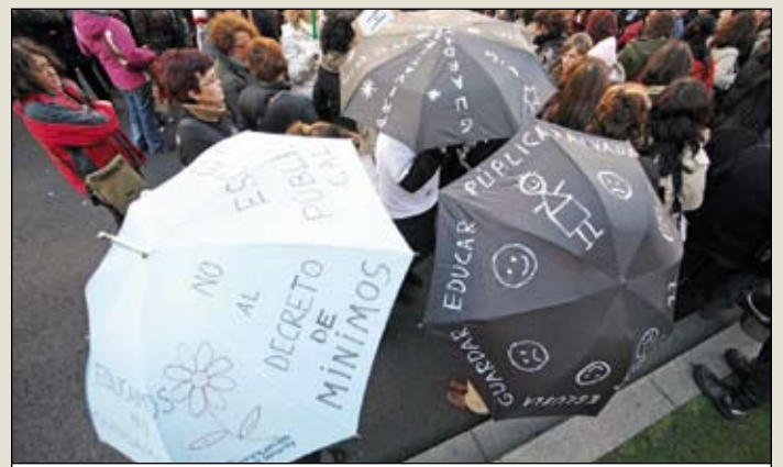
Concentración de educación infantil el día 27. JOSÉ ALFONSO