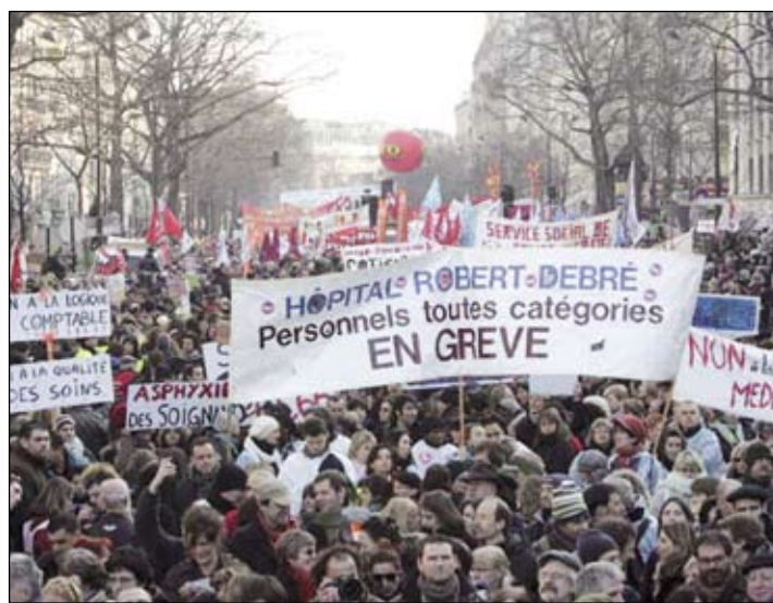
La huelga del 29 ha sacudido Francia.

En la educación, el acatamiento al paro osciló según los lugares entre el 60 y el 100 %. No es por hablar mal del vecino, pero el que suscribe vio en la marcha a colegas que nunca se metían en nada y se habían