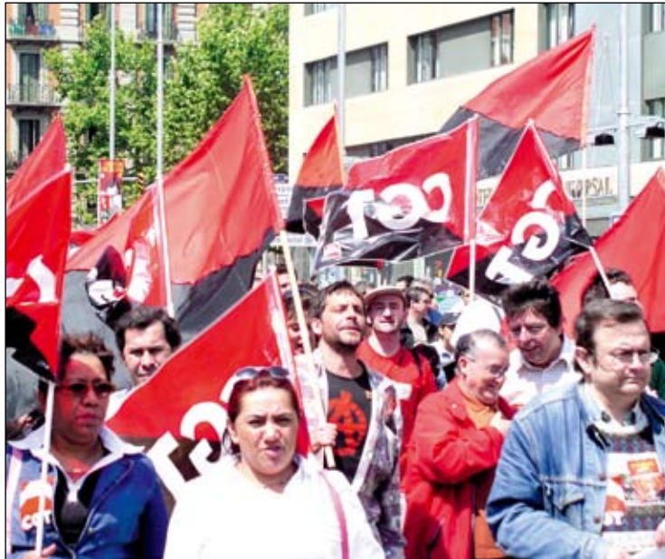
Ante el paro y la crisis: movilización.

En todos los sectores destruyen empleo. La Industria, con la Auto-