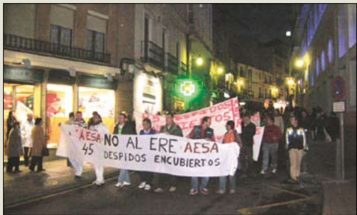
Siguen las movilizaciones ante el ERE de AESA.