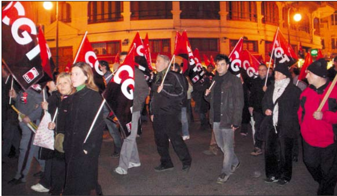
Momento de la manifestación en Valencia.

El día anterior, CGT también estuvo presente en las manifestaciones convocadas por la "Plataforma con-