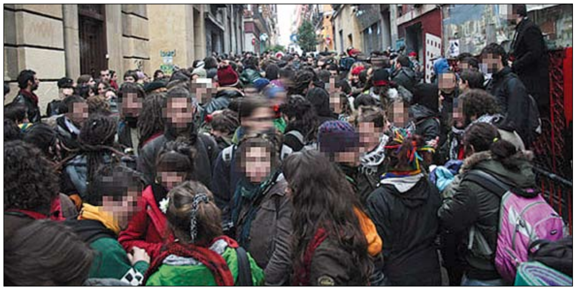
Vista de calle Acuerdo el 22 por la mañana.

Los portavoces han valorado lo sucedido como una pequeña victoria y una demostración de la fuerza y el impacto social que el Patio ha tenido en Madrid desde que naciera hace un año y medio. Ahora mismo quedan a la espera de los próximos movimientos que se puedan efectuar desde el juzgado. Desde el Patio seguiremos realizando gestiones para conseguir la anulación de la orden de desalojo.