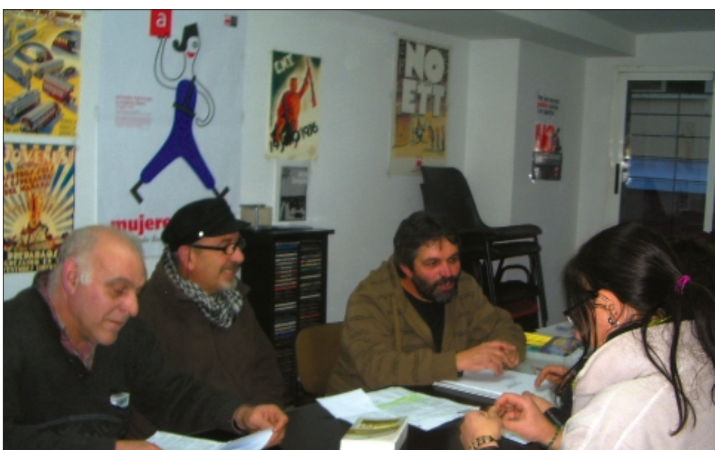
Alguns dels companys de la F.L. de CGT-Castelló durant una reunió

Avui en dia, la nostra federació local té presència en sectors com la Ceràmica, Transports i Correus, Metall, Sanitat, Banca, Camp i Comerç, Iberdrola, Oficis Diversos i un projecte de Plataforma de parats, de jubilats i la perspectiva de promoure assemblees de joves, al menys, participant, en la mesura de lo possible, en moviments ciutadans i reivindicatius, per