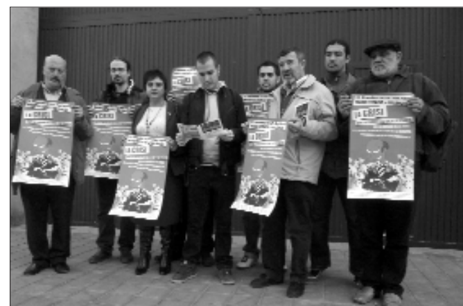
Roda de premsa de la "Plataforma contra la crisi i pels drets socials" davant del Centre d'Internament de Sapadors

Després d'haver privatitzat i subcontractat serveis al si de les universitats públiques, després d'haver redirigit les polítiques d'I+D+I cap a la transferència de coneixements al teixit empresarial i la creació de patents, després de transformar a les universitats públiques en unes entitats més en el mercat de la formació superior (proliferant els màsters, diplomes, certificats, curssets...), després d'empentar a les universitats públiques a competir pels seus recursos econòmics... Ara el que està demanant-se a les universitats públiques és que aprenen la seua formació a les necessitats del mercat laboral, acceptat per bones les demandes del mercat