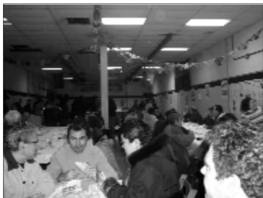
Un moment del sopar