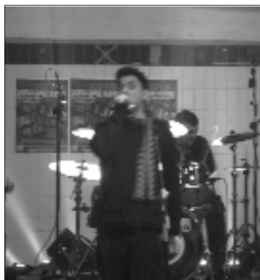
Actuació de Crisis Permanente