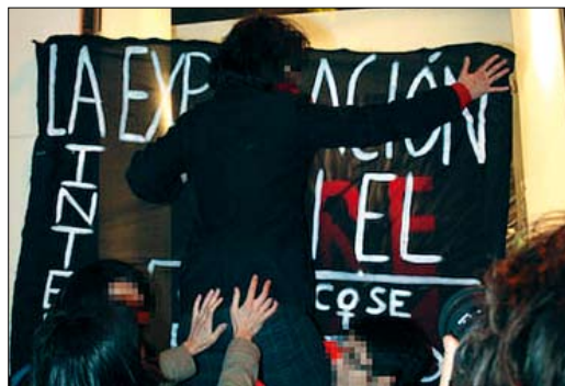
Acción en Zara.