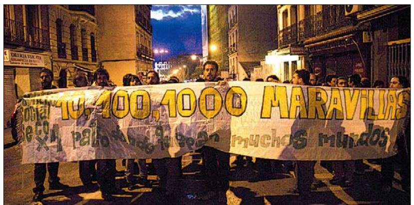
Manifestación de apoyo al Patio el 31 de enero.