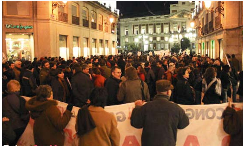
La manifestación, a su llegada a la Puerta del Sol.

Al día siguiente, se celebró la asamblea de clausura del II Foro Social Mundial de Madrid. Las 93 organizaciones que han participado en el encuentro desde el jueves al domingo la eligieron "para poner en práctica la esencia del foro: llevar lo global a lo local y dar voz a los excluidos", según explicó a los me-