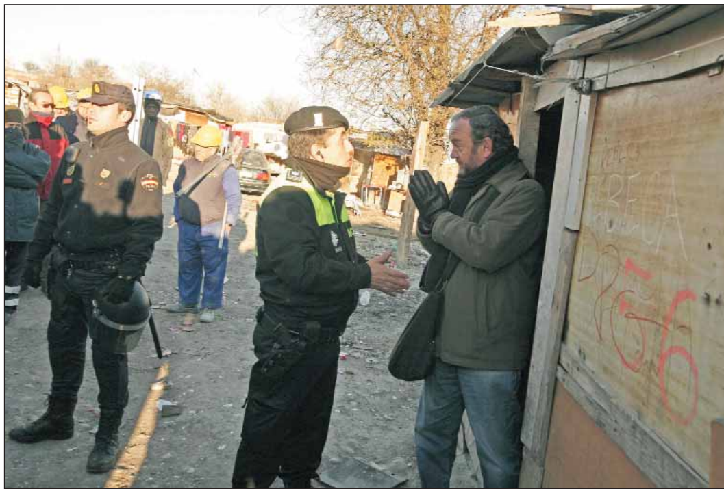
Derribos en el poblado chabolista de El Gallinero (Madrid).

Eso sí, nos consuelan porque la prohibición de entrada en caso de expulsión la reducen de 10 a 5 años, los menores de 18 años tendrán garantizada su educación -porque mejor es tenerlos entretenidos en las escuelas que en las calles-, los/as indocumentados/a por fin tendrán asistencia letrada gratuita para asegurar que se les detiene, se les retiene en centros de internamiento y se les expulsa según el estado de derecho, las ONGs podrán ejercer sus buenas acciones para con los pobres inmigrantes encarcelados en los centros de internamiento, y finalmente se les reconoce los derechos democráticos de sindicación, reunión y organización a las personas sin papeles (entre otras cosas por que así lo exigía una sentencia del Tribunal Consti-