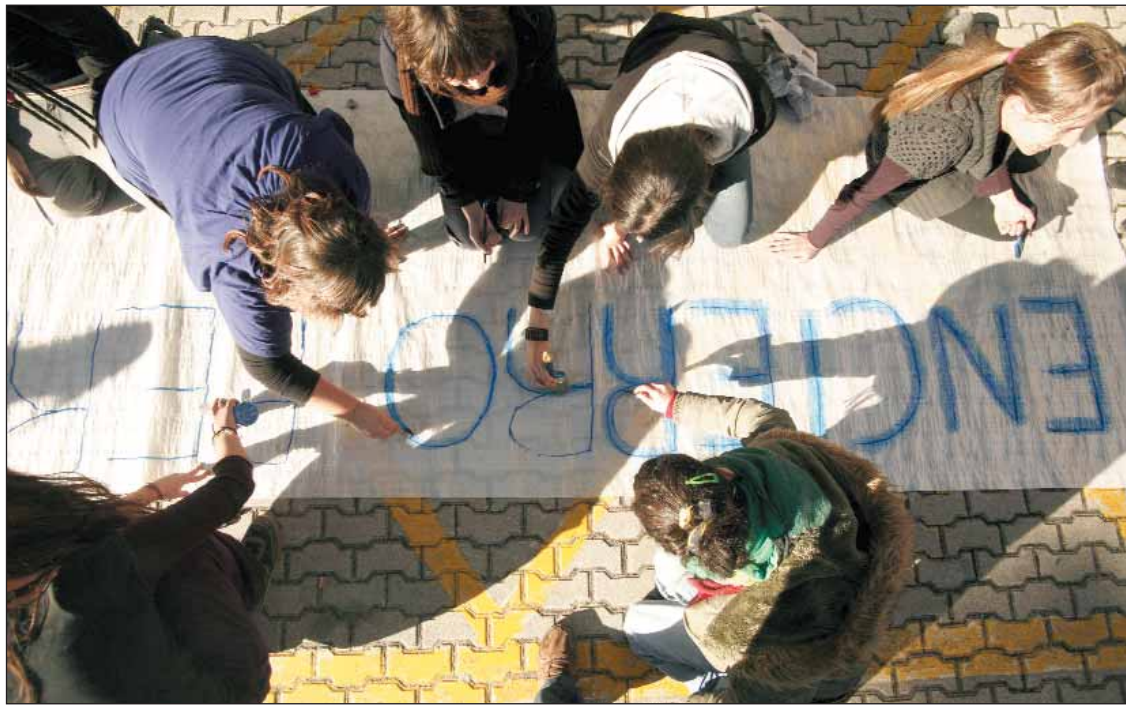
Pintando pancartas durante la ocupación del Rectorado de la Complutense.

Para conseguir una sociedad menos solidaria, profundizan en la orientación selectiva de las enseñan-