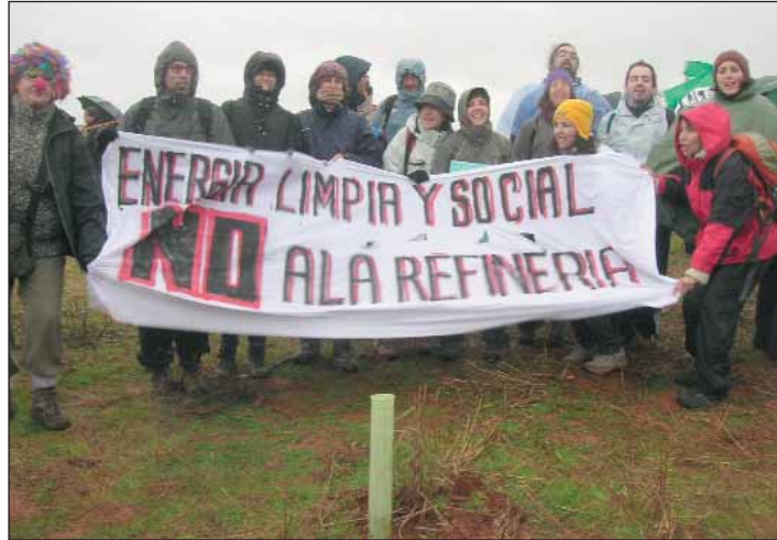
Durante la toma se plantaron encinas.

La antigua Vía de la Plata, vertebradora del territorio extremeño a lo largo de su historia transcurre por medio de la finca de San Jorge. Fue de nuevo transitada por las embarradas botas de cientos de hombres, mujeres, ancianos, jóvenes y niños de toda edad y condición: agricultores de