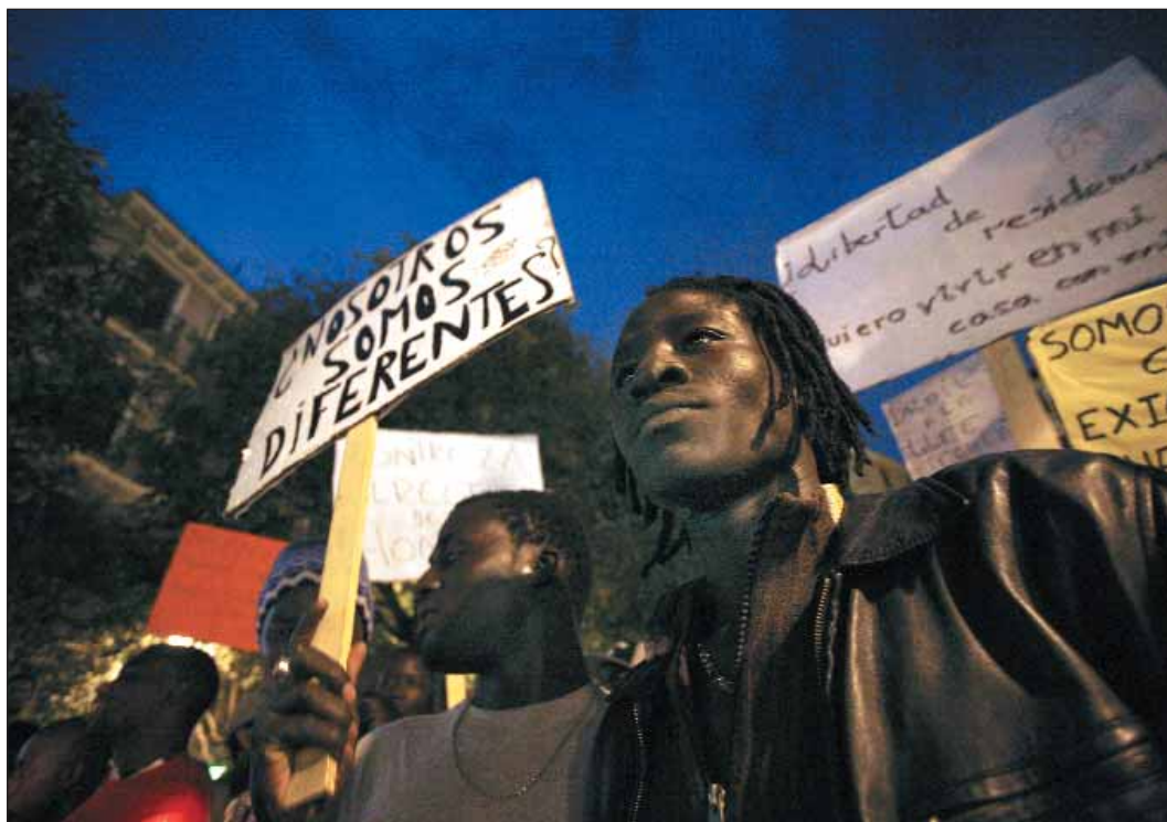
Los sin papeles ya tienen algunos derechos, pero... Para no poder ejercerlos.