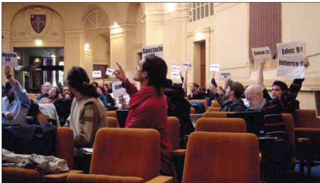
Al congreso asistieron no menos de 67 sindicatos de toda Francia.

Al nivel de la acción sindical, dentro de unas semanas la CNT