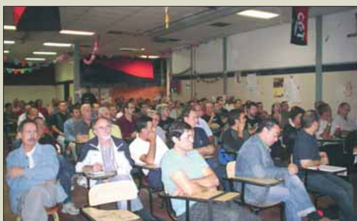
Asamblea en Valencia para preparar el 7-O.