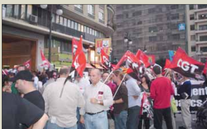
... Y así de bien salió la mani.