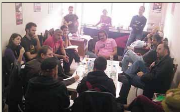
Reunión de la Coordinadora Rojinegra en Atenas.