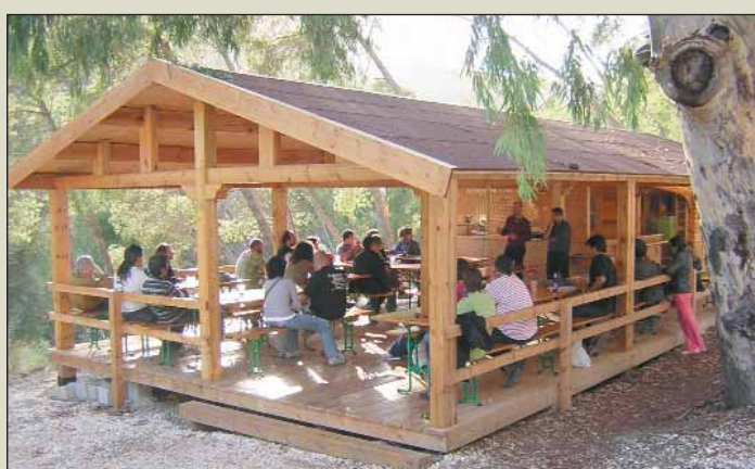
Jornadas de CGT Telefónica en El Chorro (Málaga).