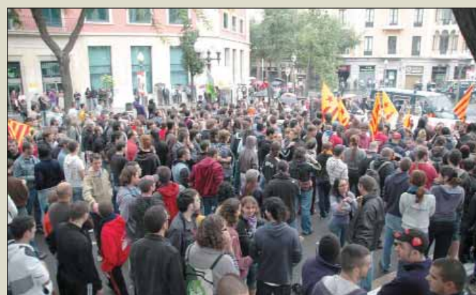
Concentración antifascista en Tarragona.