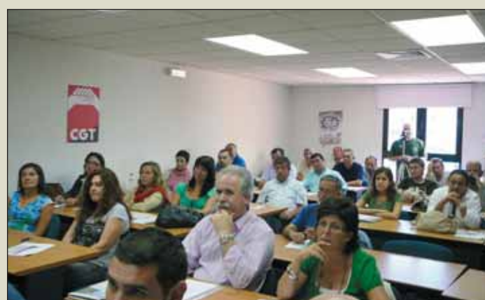
Curso en Alicante. CGT ALACANT