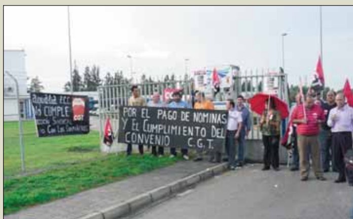
Concentración en EDAR Jerez.