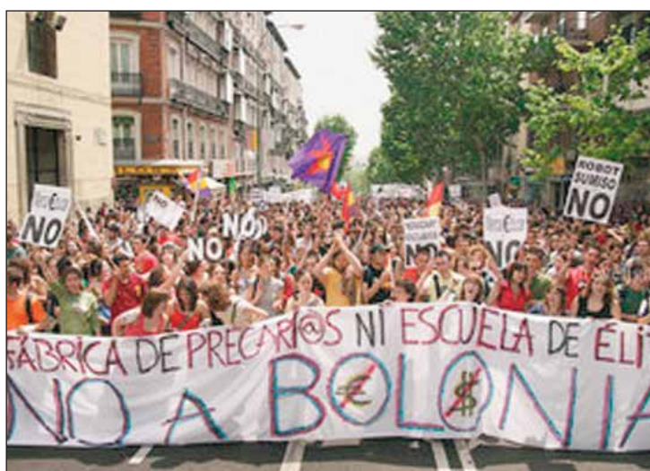
Movilización contra el Plan Bolonia.

El llamamiento a ser la sociedad más "competitiva" del mundo, sólo nos lleva al desastre. La CGT cree llegado el momento de sustituir la competitividad por la cooperación. Para conseguir una sociedad menos solidaria profundizan en la orientación selectiva de las enseñanzas universitarias, la Universidad es concebida como la expendedora de títulos "master y post master" caros y de muy difícil ac-