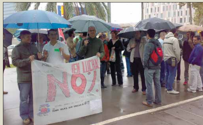
Concentración de atos Origin en Barcelona. CGT BARCELONA