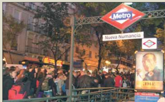
Mani por la okupación en Madrid. CENTRO DE MEDIOS