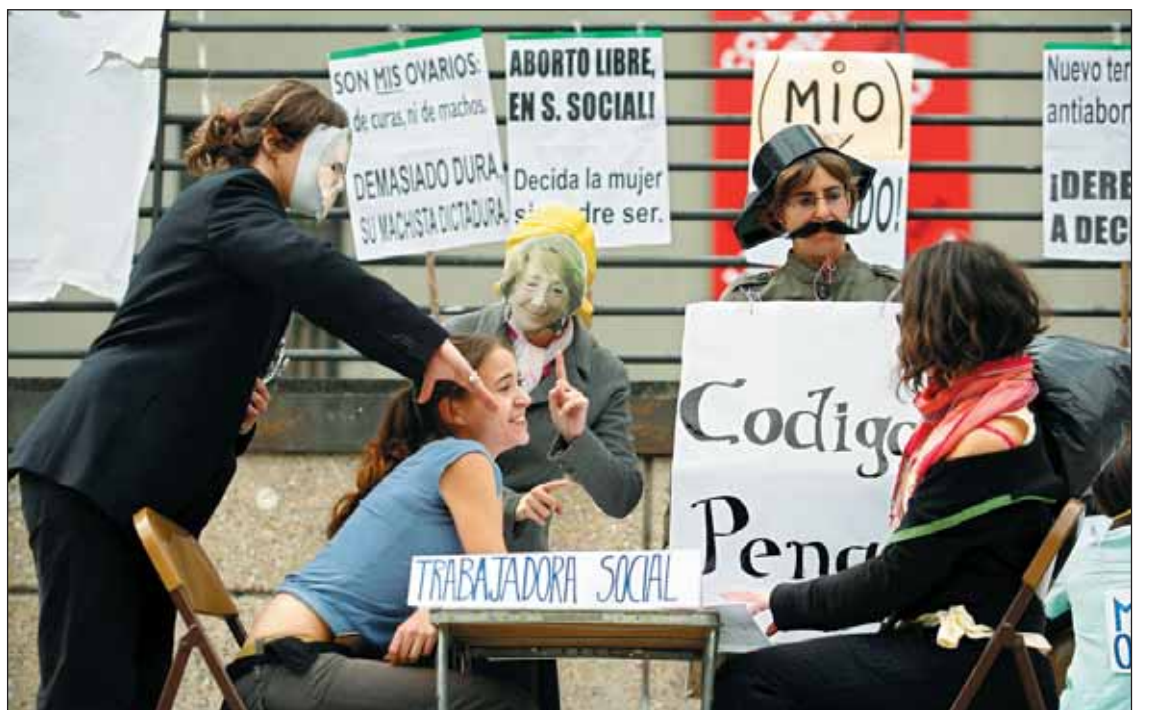
Momento de la representación teatral.

Esta concentración ha coincidido en fecha con otras reivindicaciones que han tenido lugar en distintos países de Latinoamérica y del resto del mundo.