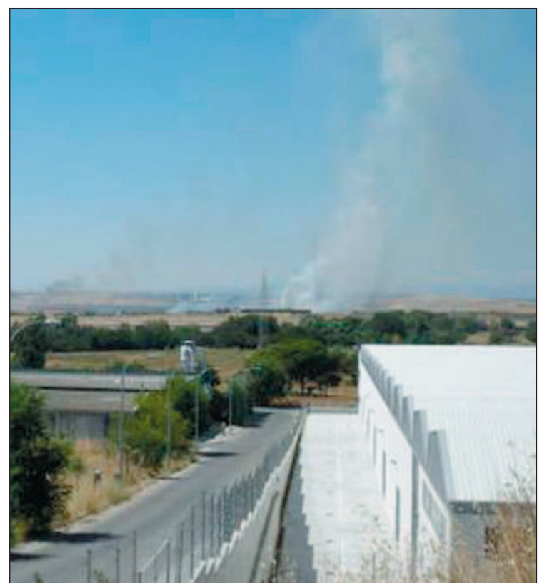
Columna de humo tras el accidente de Barajas.

También el tratamiento mediático es distinto: esos otros desaparecen rápidamente de los medios sin que oigamos sus testimonios ni saber del dolor de sus entornos familiares. De los primeros nos dan información hasta la saciedad, apelando a los elementos más sensibles de forma que causen conmoción hasta en Pekín o en la Zarzuela. Conmoción falsa, que nada cuestiona. Falsa información por más que reiterativa, que nos oculta las causas, las responsabilidades y la necesidad de cambiar nuestros estilos de vida.