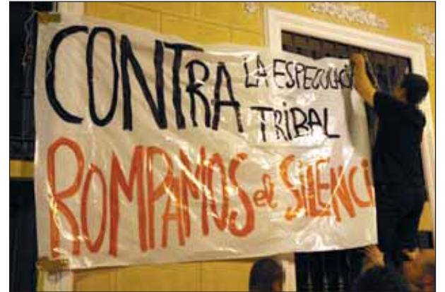
C.M. Acción de TriBall.