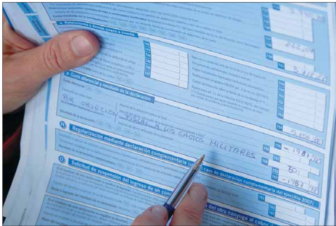
Detalle de una "declaración objetora".