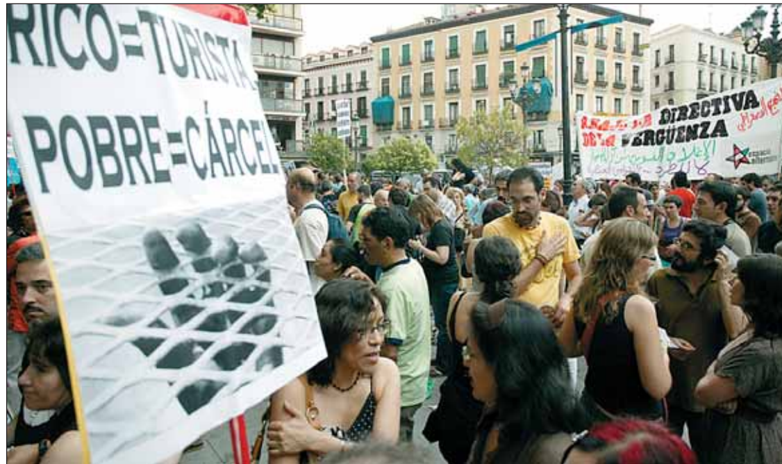
Manifestación el 21 de junio contra la Directiva de Retorno.

de junio ha sido aprobada la Directiva sobre la detención y la expulsión de las personas extranjeras por el Parlamento Europeo, en su redactado aprobado anteriormente por los gobiernos de la Unión Europea.