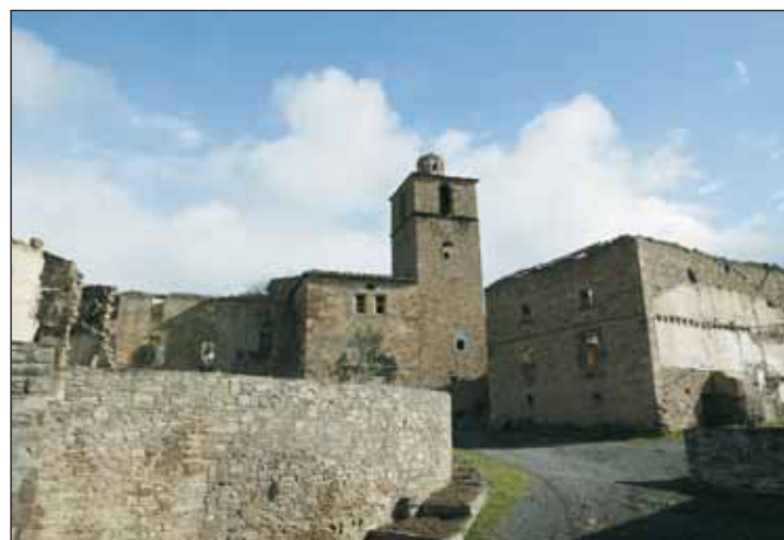
El encuentro tendrá lugar en Ruesta.