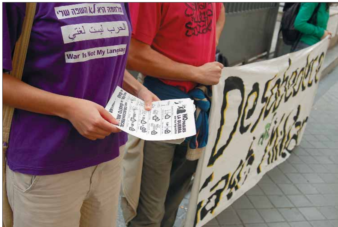
Durante la presentación también se repartió información a los viandantes.

Esta iniciativa no consiste en que quien objete se ahorre el dinero: se trata de desviar el porcentaje del gasto militar o la cantidad fija de 84 euros (uno por cada uno de los países más empobrecidos del planeta) a la lucha concreta, caja de resistencia o proyecto social con el que cada uno desee colaborar. La Confederación propone dos proyectos: la