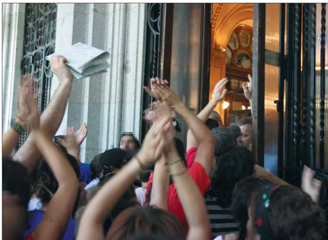
Momento del “asalto” a la Bolsa.

A esa misma hora da comienzo la manifestación convocada bajo el lema “No más sangre por petróleo”. Dos son las movilizaciones que con-