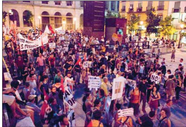
C.M. La Plaza del Reina Sofía, al término de la mani.