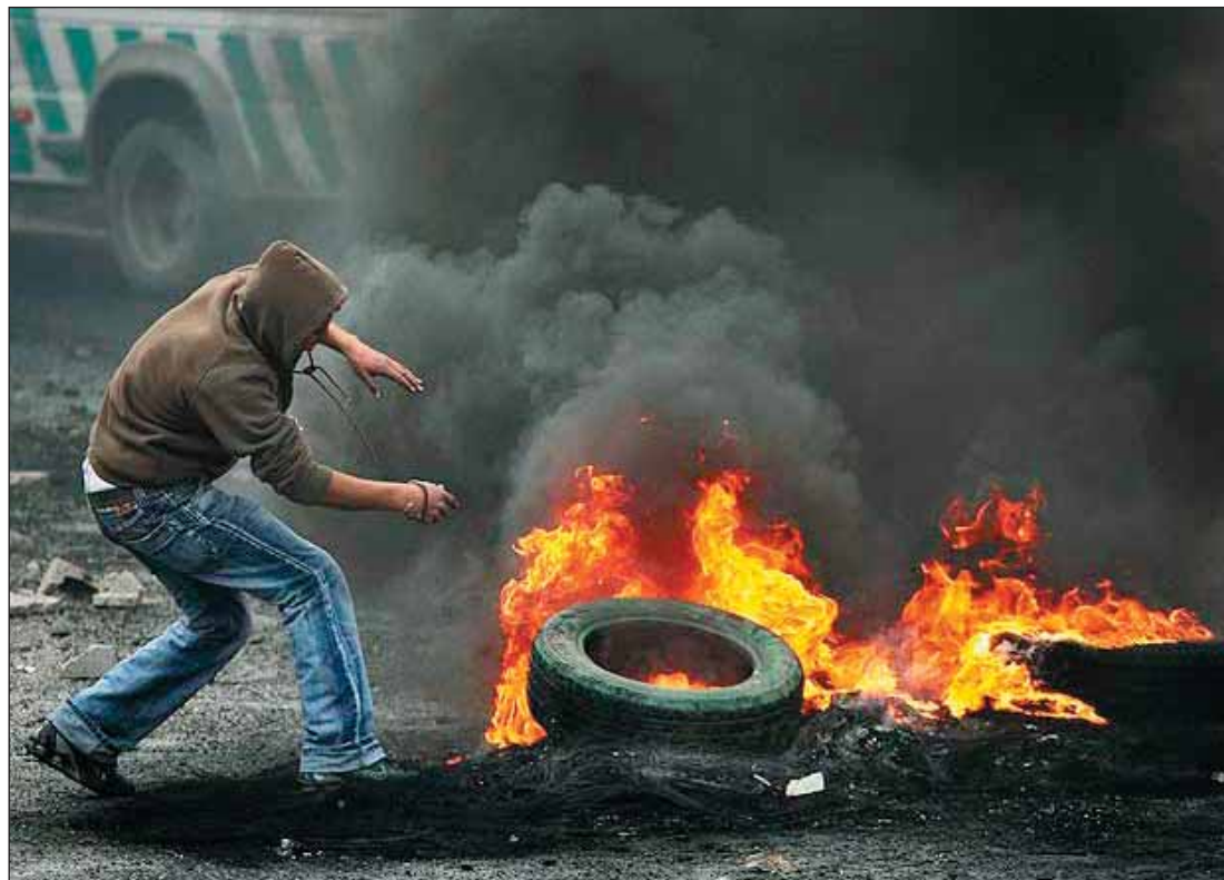
Un palestino aviva el fuego de una barricada.

Y, como ya avisaban, la respuesta no se hizo esperar: el jueves 6 de marzo alrededor de las nueve de la noche, un palestino entró en la "yeshiva Merkaz Harav" (escuela religiosa sionista) de Jerusalén y mató a ocho personas, hiriendo a otras veinte, antes de que le acorralaran a balazos. Esta escuela, fundada hace ochenta años, pertenece a la ideología del Partido Nacional Religioso, es decir, extremistas y ultraortodoxos que quieren la colo-