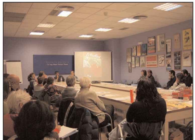
Dalt: taula rodona al Colegi Major Rector Pesset. Baix: cartell de les IX Jornades Llibertàries.