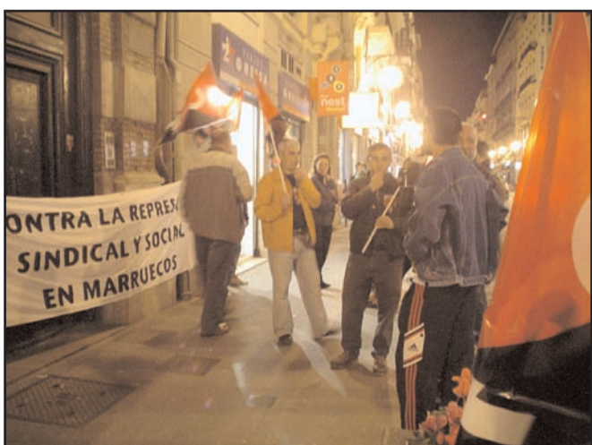
Companys de CGT a les portes del Consolat de Marroc.