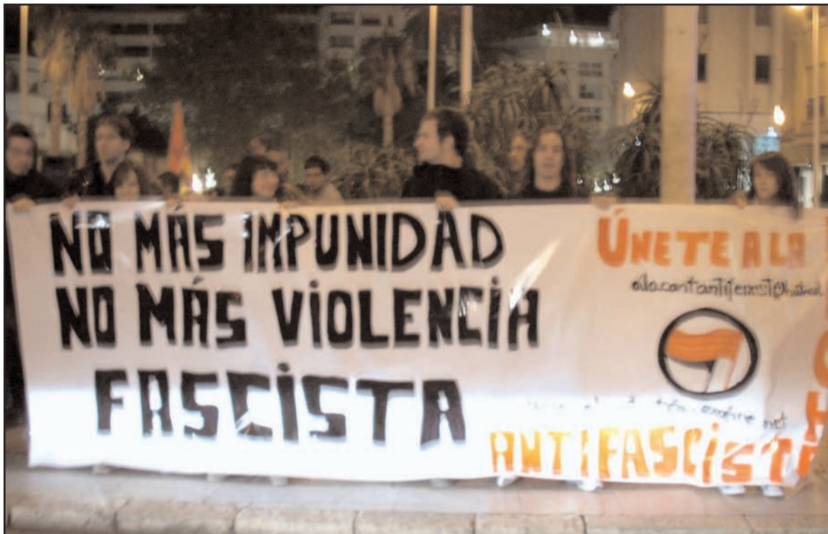
Concentració a Alacant passat 17 de Novembre en contra de la violència feixista.

Denunciem a una "justícia" còmplice i en la que la persona agredida s'enfron-