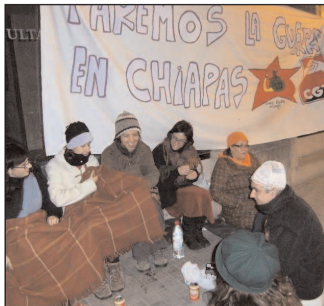
La nit del 4 al 5 de desembre, a la porta del consolat.

El cònsol es va limitar a reconèixer que la situació en Chiapas s'estava complicant de forma alarmant i que transmetria les nostres inquietuds al Consolat de Barcelona per a, des d'allí, ser