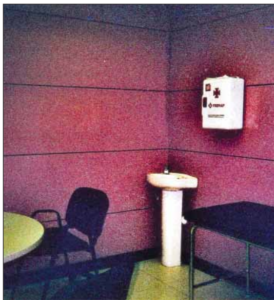
Sala de primeros auxilios.