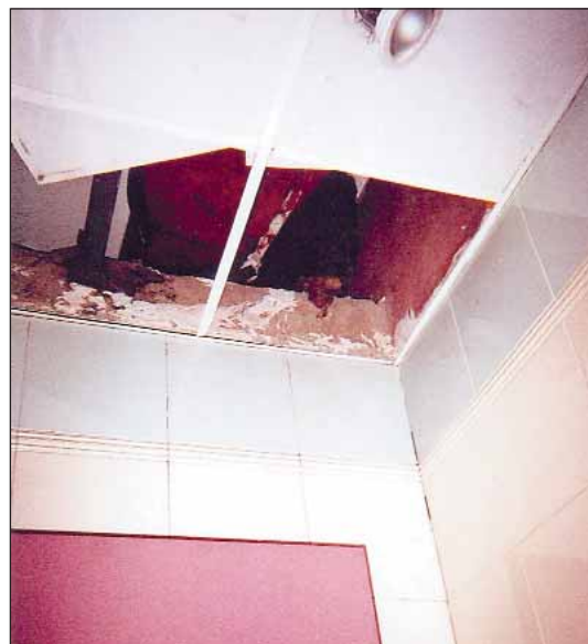
Detalle del techo del baño.