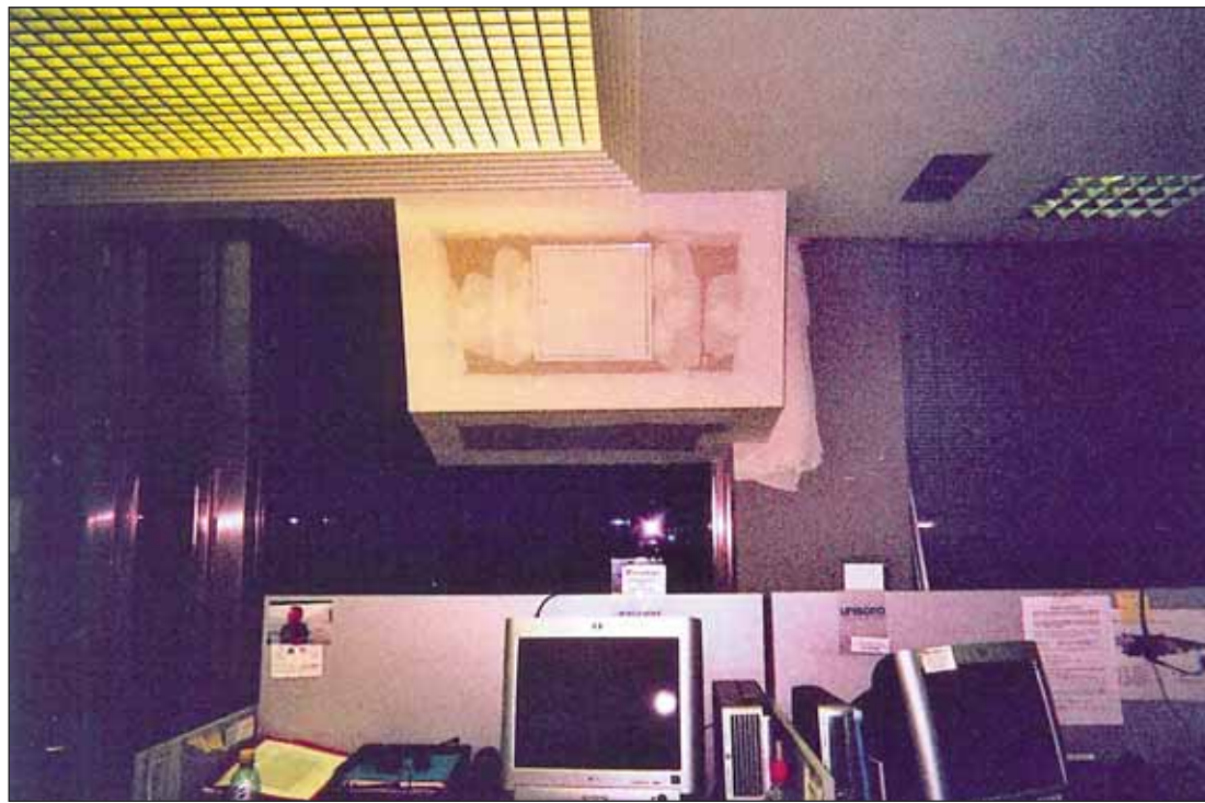
Nueva instalación de aire acondicionado en Unísono Gijón.

Desde la Confederación General del Trabajo tomaremos las medidas legales y sindicales necesarias para conseguirlo.