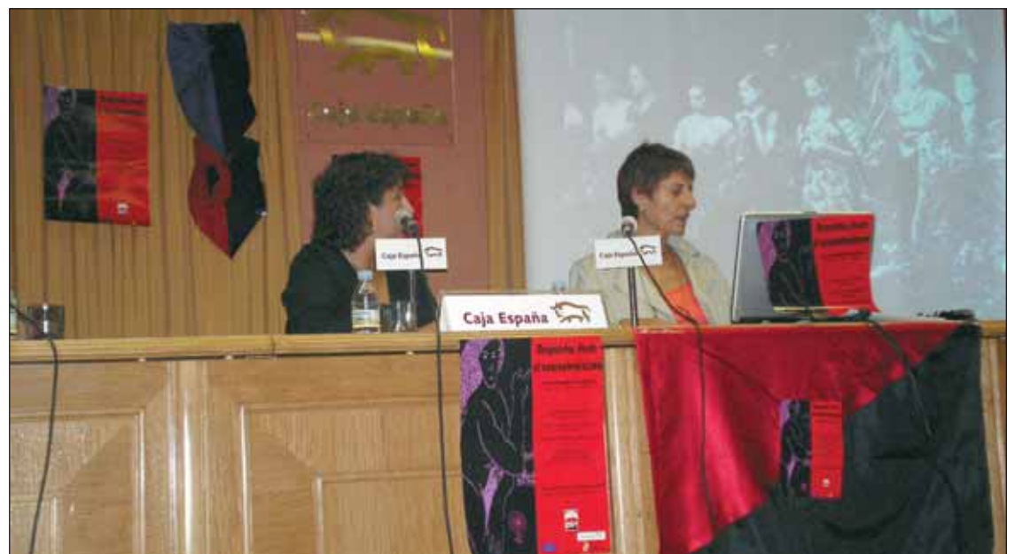
Un momento del homenaje a Mujeres Libres celebrado en Palencia.

eres; preguntamos y respondimos desde la acción anarcopeminista, porque el feminismo que ellas pusieron en práctica (como reconocemos ahora con orgullo, lejos de malos entendidos y apropiaciones indebidas) fue el más radical y avanzado de su tiempo. Mujeres Libres dio una lección a sus compañeros anarquistas, y también a algunas compañeras, de su compromiso y su lealtad con el movimiento libertario. Lo hicieron sin renunciar a aquello que consideraban básico para la emancipación de la mujer: la acción colectiva y la autonomía. Esos grupos de mujeres querían participar en igualdad con sus compañeros sin renunciar a la autonomía que consideraban imprescindible y, a pesar del arrinconamiento que les propinó la estructura