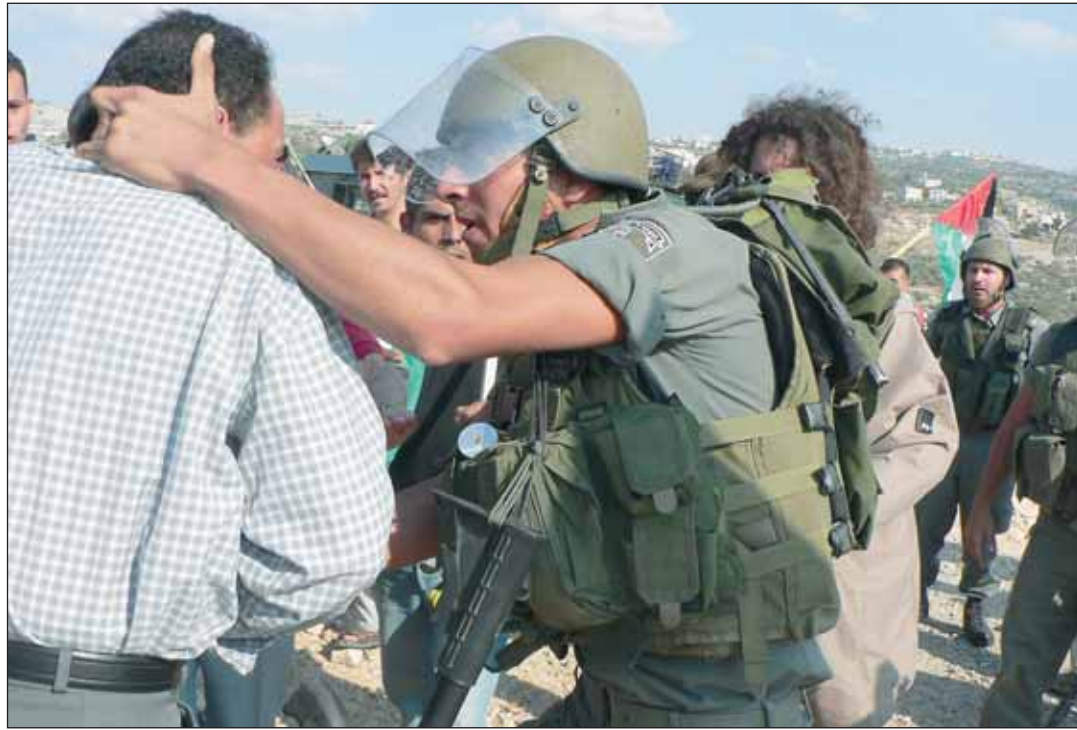
El ejército israelí mantiene Gaza cerrada a cal y canto.

Pero los actores internacionales tenían ya su plan previsto: había que reponer a Al Fatah en el poder. Así pues, en los últimos días hemos asistido al "golpe de estado" que este partido ha llevado a cabo. Si bien hay que decir que la jugada no le ha salido a Abu Mazen todo lo bien que esperaba, pues después de haberse reunido con Olmert y sus sicarios, el rey de Jordania y el presidente egipcio, se ha vuelto a casa sin los muchos millones que estaban destinados para la ayuda al pueblo palestino y que Israel tiene "retenidos" desde que salió vencedor el partido de Hamás. Y el pueblo palestino sigue sufriendo las mismas ignominias.