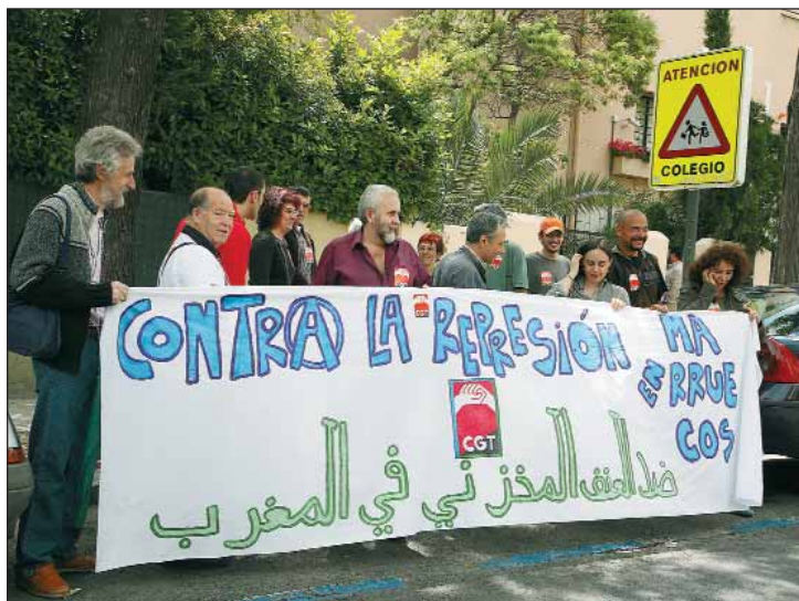
CGT, frente a la Embajada de Marruecos.

Consideramos totalmente injustificada la enorme represión ejercida por las fuerzas policiales marro-